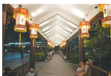
位于奥飞广场的灯谜长廊