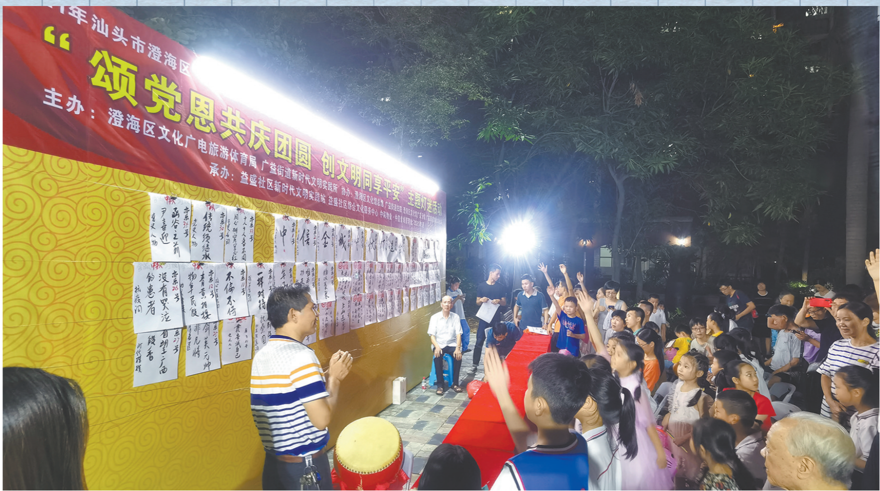
澄海灯谜活动盛行

据悉，本次入选“中国民间文化艺术之乡”建设典型案例名单的案例将在全国推广。侨乡汕头澄海，将再一次迎来举世目光，向外界讲述它历史悠久的灯谜故事。