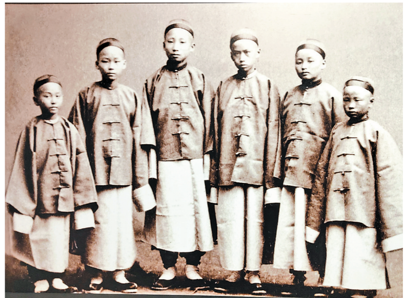
1872年第一批留美幼童刚到旧金山时的合影 资料图

“官派留美幼童计划”虽然被终止，但120名幼童极大弥补了近代中国走向现代化的人才空缺，出现了日后中国近代化过程中各行各业领军人物。