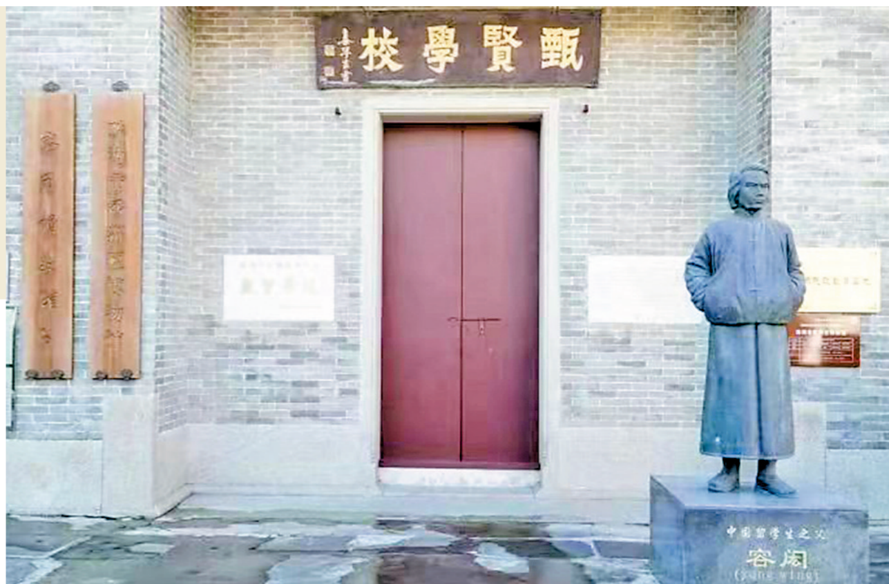
中国留学生之父容闳

尽管“官派留美幼童计划”在清政府保守势力的反对下终止，但这个计划开了中国官派留学之先河，120名留洋幼童中走出了一大批影响近代中国历史进程的人物。