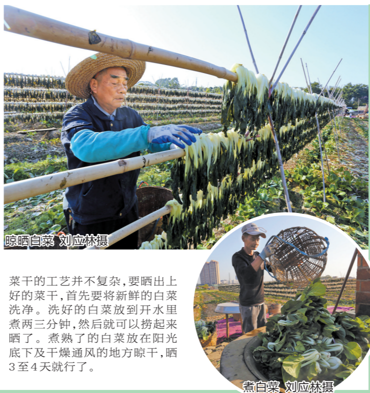
晾晒白菜