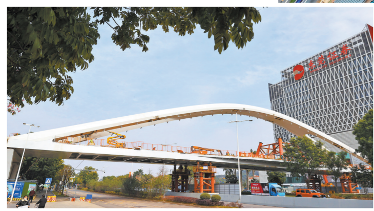
横跨东莞大道之上的2号桥