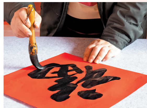
书法家现场挥毫为市民送“福”