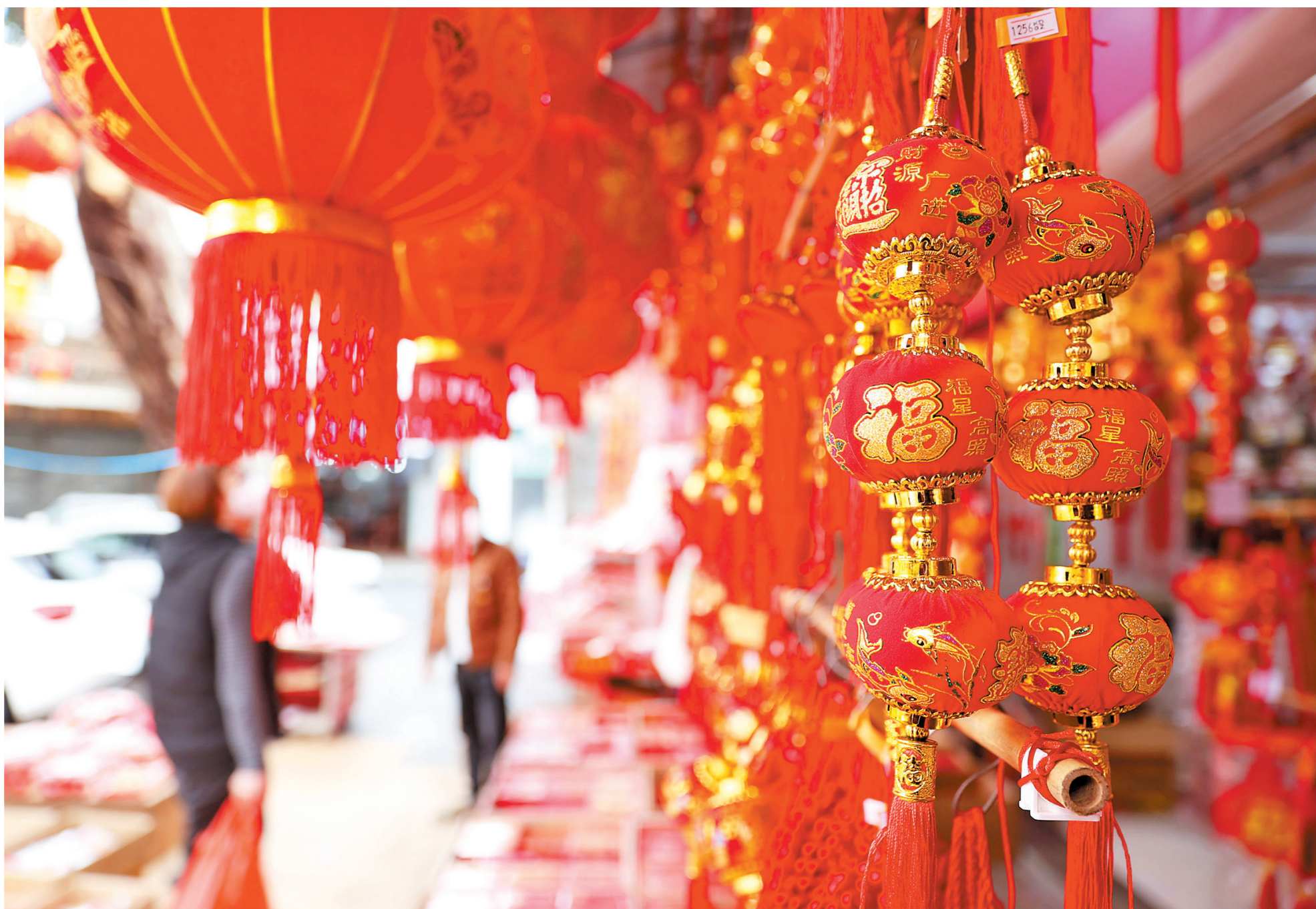
莞城振华路红红火火的春节装饰品让人目不暇接