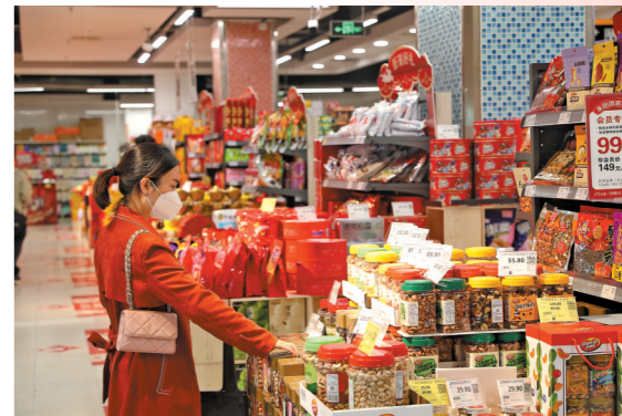
超市里琳琅满目的年货

喜庆的大红灯笼、寓意吉祥的对联、琳琅满目的糖果饼干……春节即将到来之际，东莞各老街已充满了浓浓的年味。