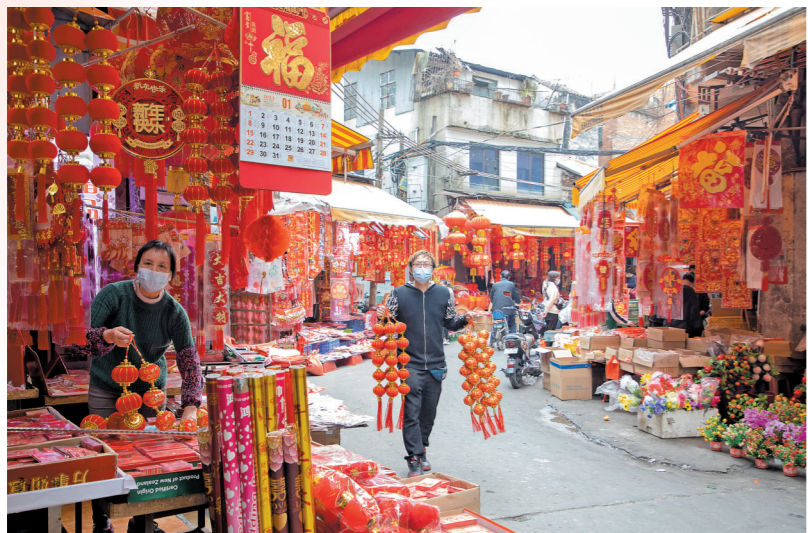
虎门老街区类丰富的春节装饰品

春节将至，忙碌奔波了一年的你，不妨暂时放下疲倦与繁忙，约上家人朋友，到老街逛逛，近距离感受东莞浓郁的年味儿。