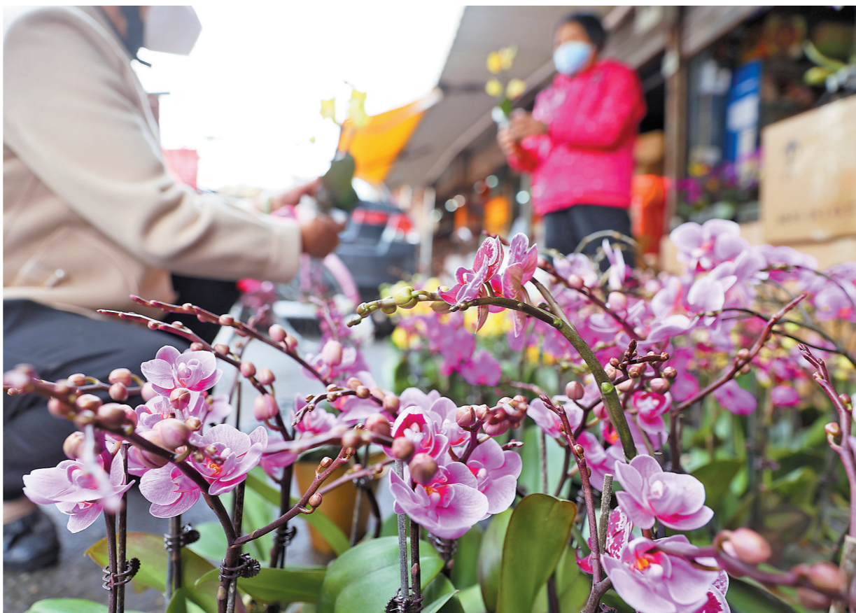
细村市场的年花销售正旺