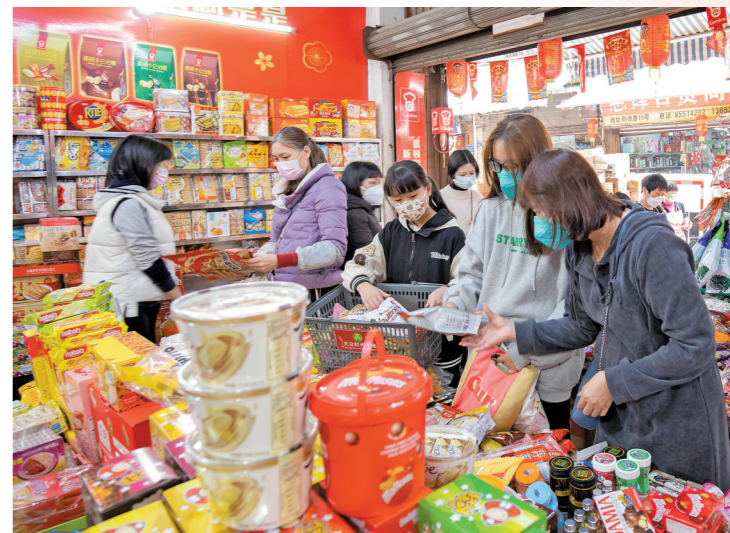
深受小朋友欢迎的零食杂货铺