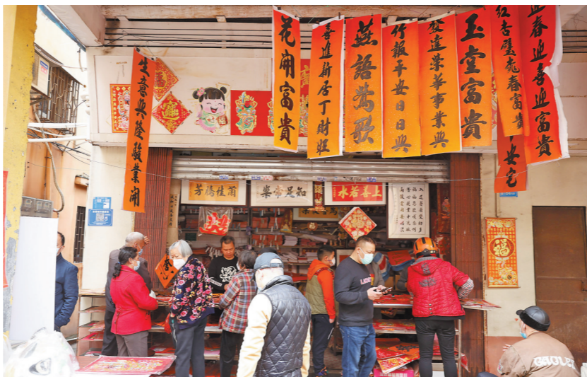
莞城维新路上，街坊正选购对联