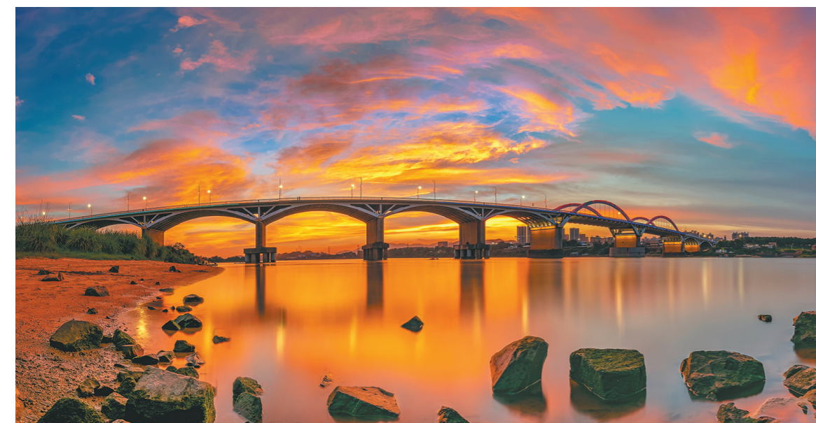
夕阳余晖,东江晚照