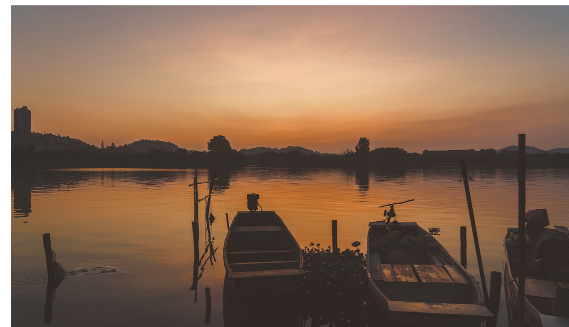
东江日出