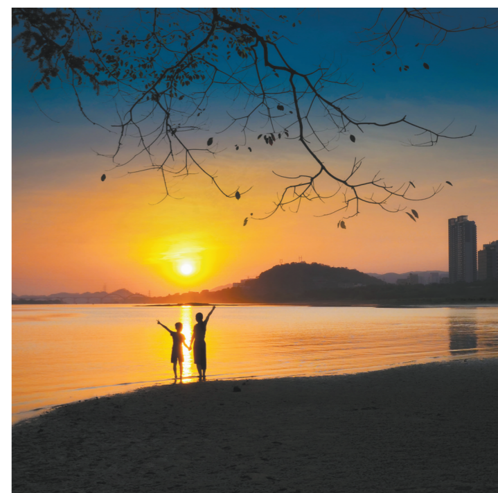
夕阳下,人水交融

一个城市的水脉,就是一个城市的命脉。近年来,“半城山色半城水”的惠州市,把治水作为最大的民生工程,持续加大对东江的保护力度,积极采取多种措施加强水生态保护。不少市民自发成为志愿者,用实际行动呼吁大家关心和爱护东江,一起参与到保护母亲河的行动当中。如今的东江,人水和谐、白云舒卷、水鸟翱翔,宛若一幅壮美的生态画卷。