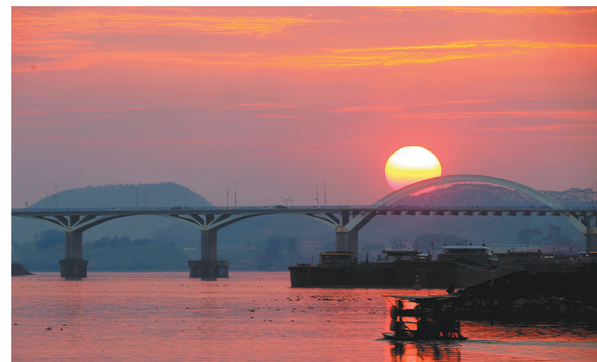
日落归渔