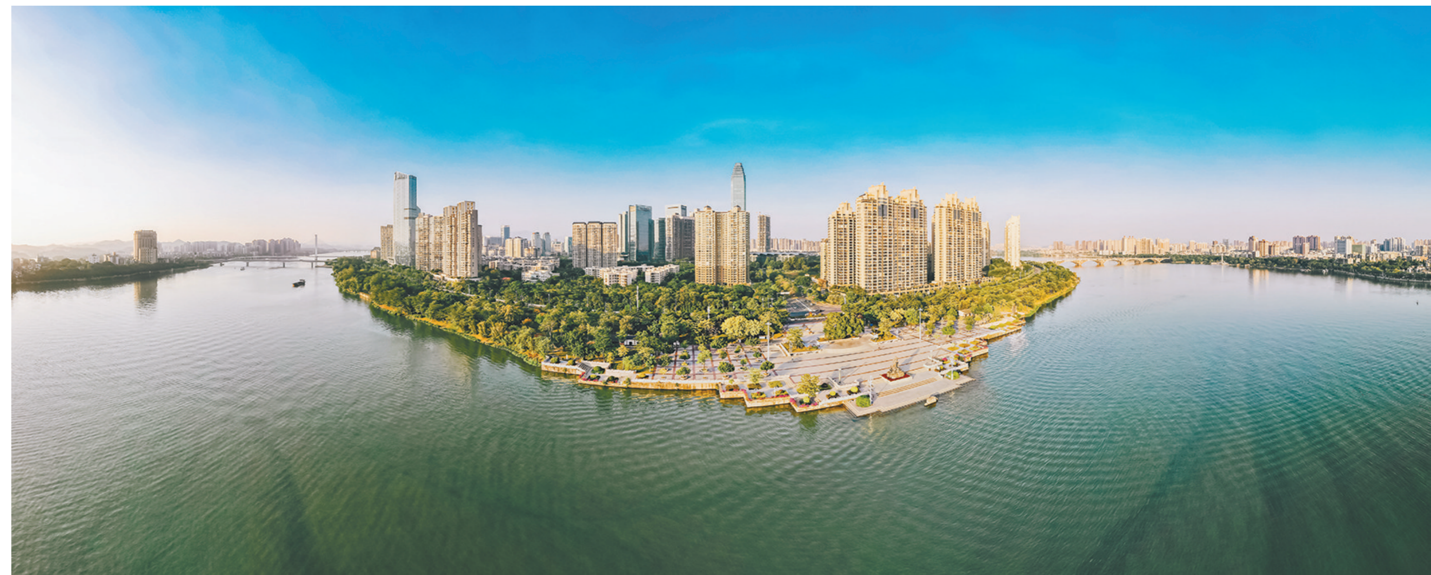
航拍东江公园