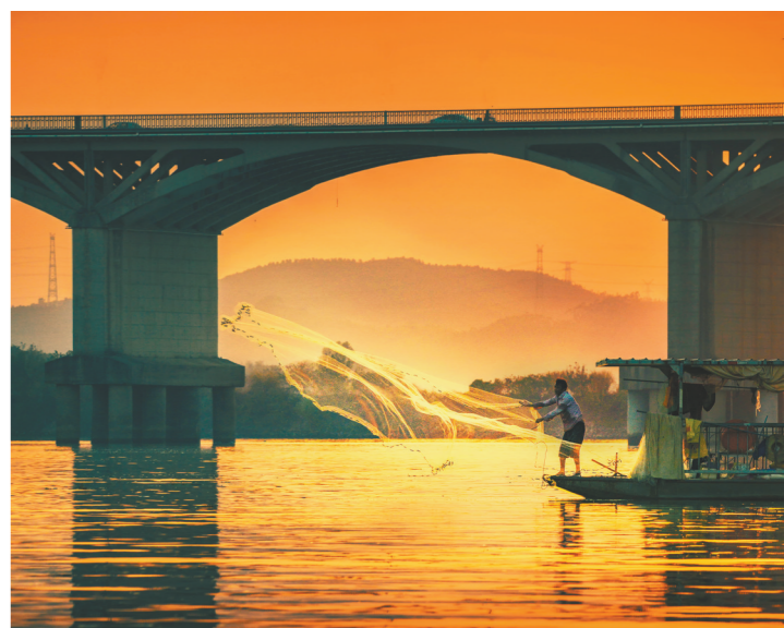
东江哺育了一代代渔民