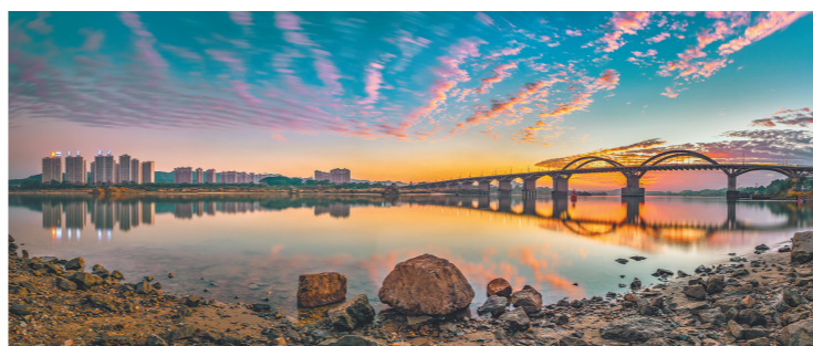
江水共长天一色