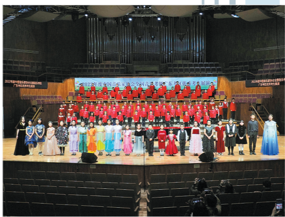
中国音协广东考区展演合照