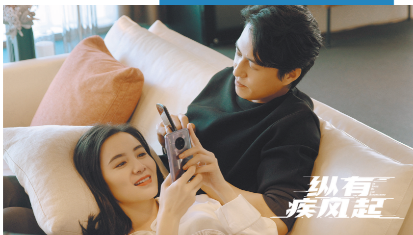
宋佳、靳东在剧中“相爱相杀”