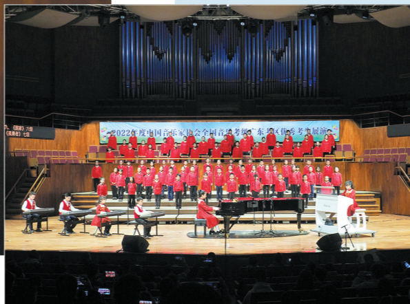
1月11日展演压轴节目《国家》(孤勇者)