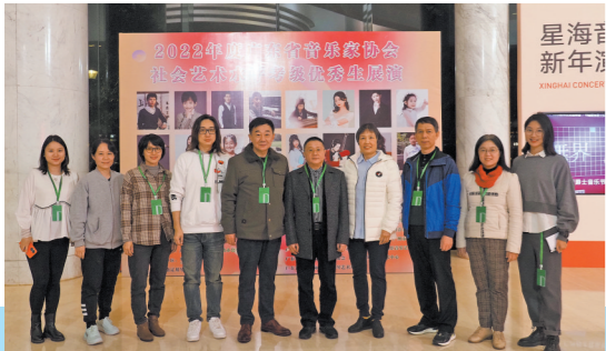
广东省音乐家协会工作人员合影