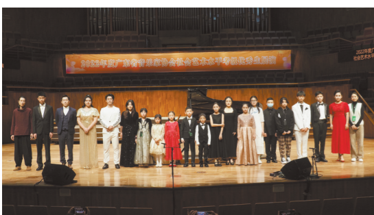
广东省音协艺术水平考级展演优秀考生合影