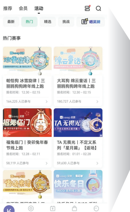
Keep 平台上的奖牌比赛活动页面,多项比赛正在招募