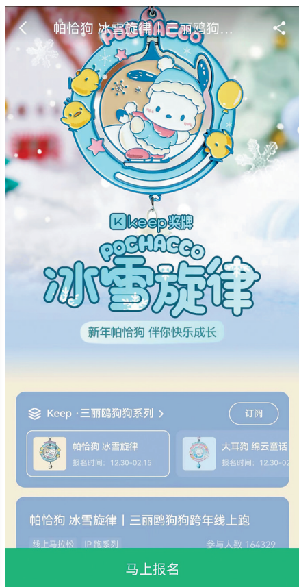
记者参加的 Keep 奖牌比赛的报名页面