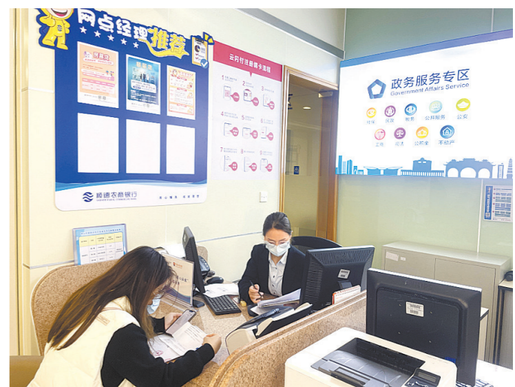
容桂进一步打造便民利民的营商环境

羊城晚报 记者杨苑莹、通讯员容市监摄影报道：22日，记者从顺德区容桂街道了解到，为进一步打造便民利民的营商环境，容桂市场监管所打造“15分钟政务服务圈”，将21项商事登记业务延伸至银行网点，将政务服务送到办事群众身边，实现“马上办、就近办、家门口办”。