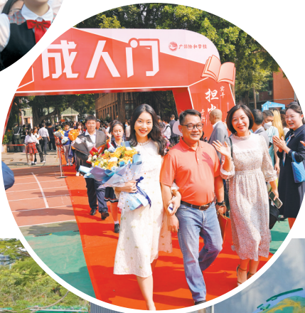
▼广州协和学校举行高三学生成人礼