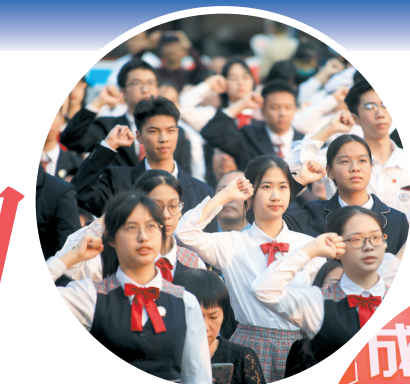
▲铁一越秀校区的成人礼现场

记者采访了解到，除铁一外，上周末，广州市协和学校、广东华侨中学、广州市第一一三中学等学校也为高三学子举行了成人礼。阳光下，同学们盛装出席，在家人的陪伴下步上红毯，迈过“成人门”，接受来自老师、同学、家人的祝福。跨过成人门，代表着与稚嫩告别，走进十八岁的成人世界；代表着未来的浩瀚之旅即将开启，肩头多了一份责任与担当；代表着昨日的奋斗和汗水，终将成就明日闪亮的自己。