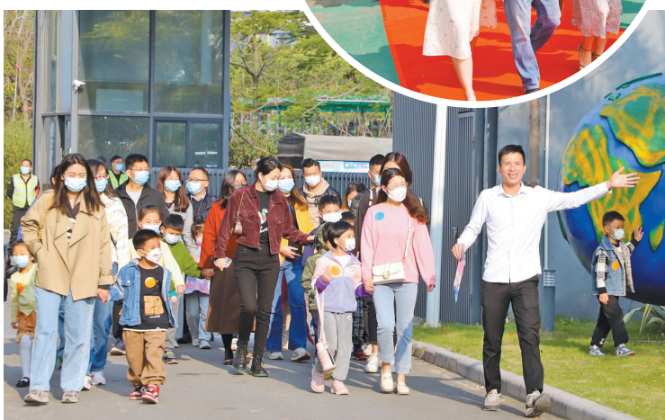
▼2月25日，番外外国语学校举行校园开放日