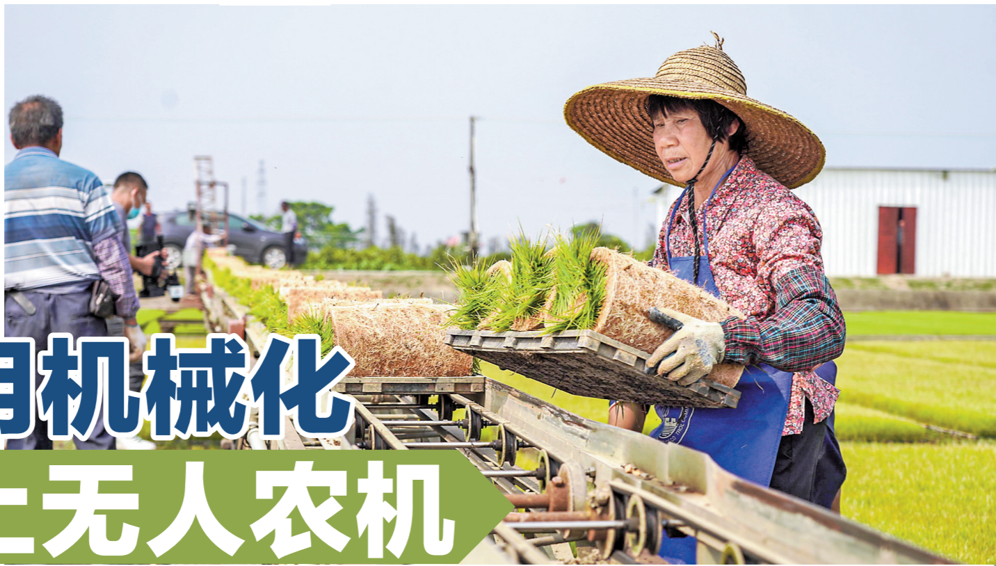
工人正在生产线上铺秧盘