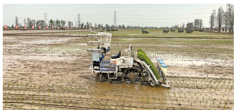
无人农机在示范作业

在江门农业生产中推广。江门市农业农村局农业机械化推广科工作人员杨明祥介绍：“江门市共有农机社会化服务组织超过200家，农机专业合作社142家，其中2家人选全国‘全程机械化+综合农事’服务中心典型案例，6家被评为省级‘全程机械化+综合农事’服务联合体。”