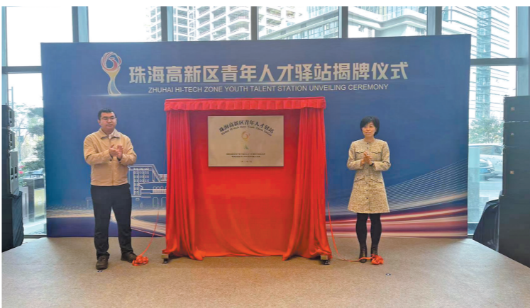
珠海高新区“青年人才驿站”揭牌

江门市农业农村局相关负责人表示，江门将全面实施“农机装备补短板行动”，推动智能农机装备应用，大力发展智慧农机、智慧农业。下一步将继续发展基于北斗辅助驾驶系统集成应用农机装备的应用，推动水稻机械化生产向智能机械化转型升级。此外，今年将实施江门“广东第一田”提升工程，建设无人农场，水稻全程机械化技术示范基地；高标准建设智慧农机装备产业园，提升高端智能农机装备自主研发水平，确保农机化发展水平继续保持全省前列。