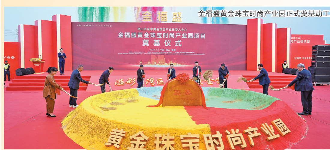
金福盛黄金珠宝时尚产业园正式奠基动工

随着互联网经济的快速发展，网络餐饮的食品安全问题越来越受到社会各界的广泛关注。此次南海区市监局与饿了么平台共同签署合作备忘录，将进一步探索线上线下一体化协同监管新模式，实现信息共享、监管执法互助，推动建立政企协同数字化监管新格局。