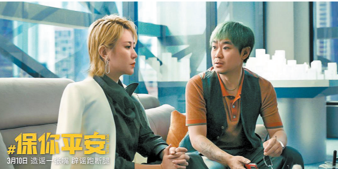
马丽10年前跟大鹏合作过《屌丝男士》第二季