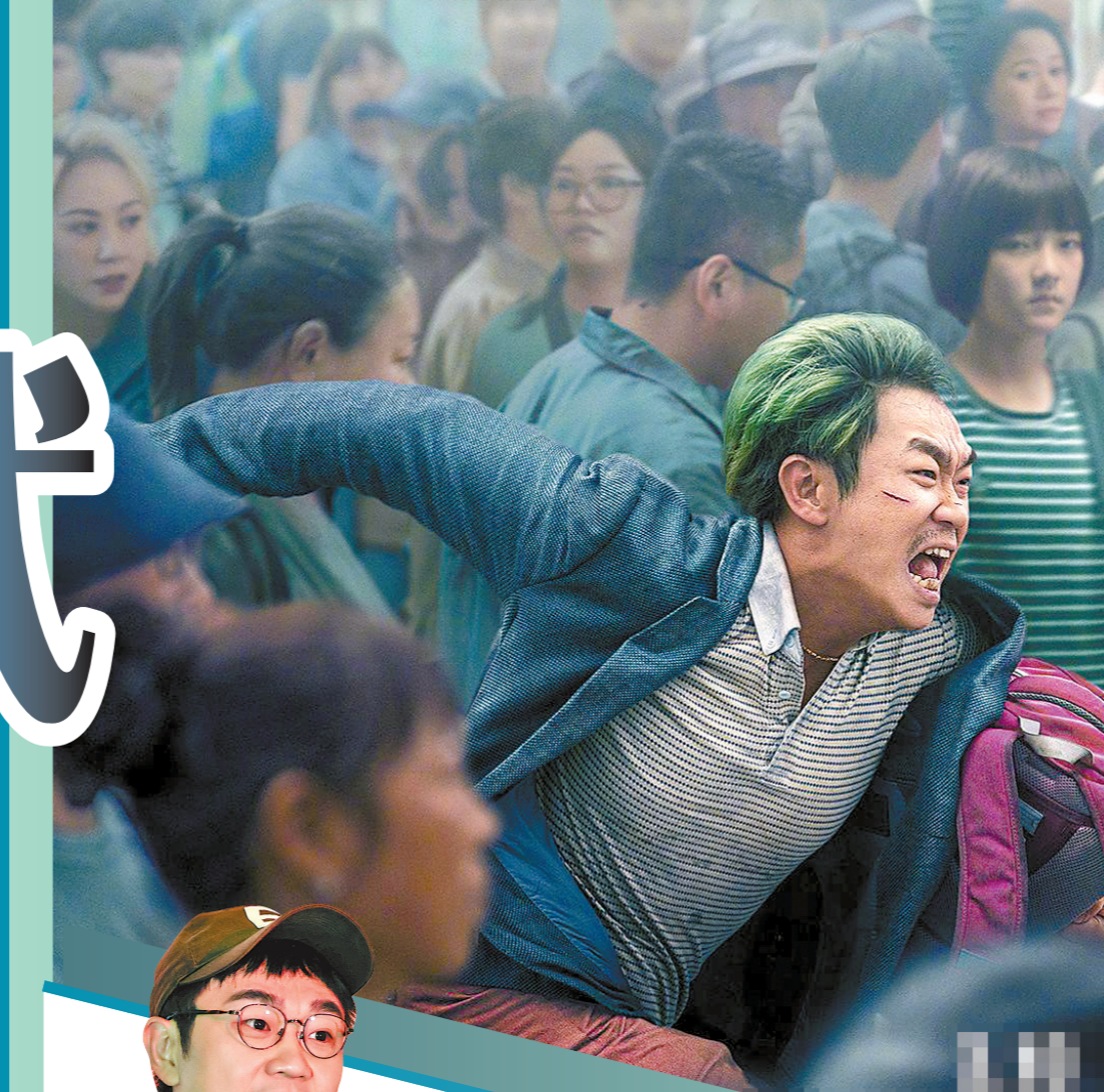
大鹏扮演的魏平安千里追踪,寻找造谣辟谣者