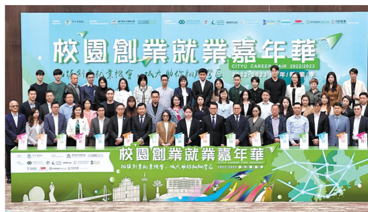
珠西双创园及江门人社部门参与活动代表与澳门城市大学师生合影

羊城晚报讯 记者陈卓栋,通讯员张文宝、谭耀广摄影报道:记者15日从珠西先进产业优秀人才创新创业园(下称“珠西双创园”)获悉,日前,江门市人社部门联合珠西双创园运营中心组织优秀企业代表前往中国澳门,参加澳门城市大学“校园创业就业嘉年华”活动,开展澳门高校毕业生就业专场招聘,吸引更多留学生回江发展。