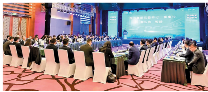
交流座谈会现场

格力集团被投企业、合作伙伴企业代表感谢格力集团为银行和民营企业搭建了共商合作、共增发展的宝贵平台,相信在格力集团的多维赋能和银行的强劲助力下,民营企业能够更好地抢抓市场机遇,实现更加健康有序、良