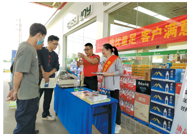
江门中石化设置油品展示台并现场答疑