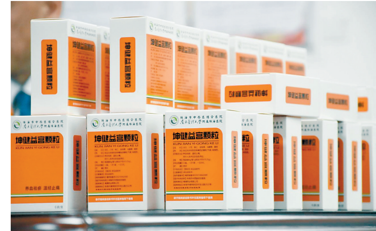
坤健益宫颗粒正式推广使用

用于治疗消渴病气阴两虚证的患者,且取得较好疗效,大部分患者症状改善明显,血糖较前稳定。 在当天的“坤健益宫颗粒”启用仪式上,珠海市中西医结合医院和粤澳合作中医药科技产业园的负责人一致决定接下来携手加快促进第二批协定方制剂转化。对已转化的成果,双方互相提供资源,争取获得更多的政策支持,减少院内制剂调剂阻碍,开拓市场,扩大服务范围,促进成果“走出去”。