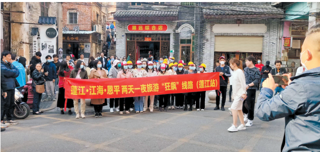
近期大量游客“跟着‘狂飙’去旅行”

数据的增长直接体现在《狂飙》取景地的人流。春节假期结束后，连续多个周末，长堤、墟顶、梅家大院等取景地均车水马龙，游人摩肩接踵。据长堤历史文化街区相关管理部门监测，春节之后，街区内日人流最高达到40000人次。