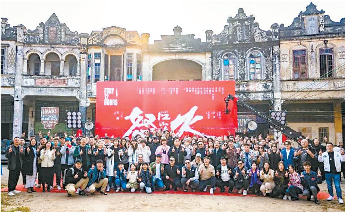
《怒火12小时》在江门台山开机

记者了解到，江门市政府正从方向、规划等着手，借助影视IP赋能，推动城市文旅业融合发展，既能创造热度“引客来江”，又以自身品赋“留客在江”。江门市委副书记、市长吴晓晖日前更明确表示，江门市将积极打造大湾区重要的优质影视作品取景拍摄地及后期制作地，持续做好历史文化街区和历史建筑保护与活化利用，大力发展文旅产业，不断提升江门城市知名度和美誉度。