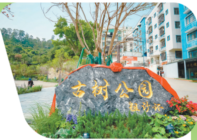
粗沙环古树公园开放

目前，合作区共有8棵古树被纳入古树名录，分别分布于横琴勒流、三塘村、深井村和粗沙环村，树种为榕树、心叶榕、樟树、台湾相思，树龄在100年-260年不等。自合作区成立以来，合作区城市规划和建设局积极开展古树保护工