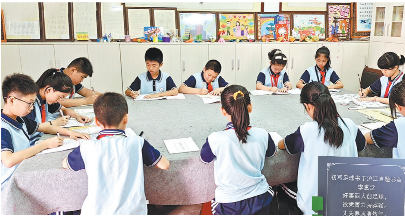
学生们乐于学习诗词文化

2016年，五华县荣获“广东省诗词之乡”荣誉称号；2018年被中华诗词学会授予“中华诗词之乡”荣誉称号。这成为继“工匠之乡”“足球之乡”“文化之乡”之后，当地又一张靓丽的名片。