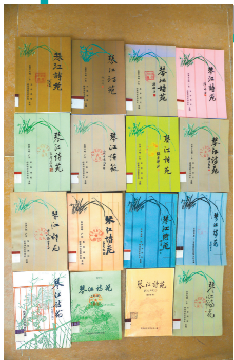
五华诗社每年出版《琴江诗苑》