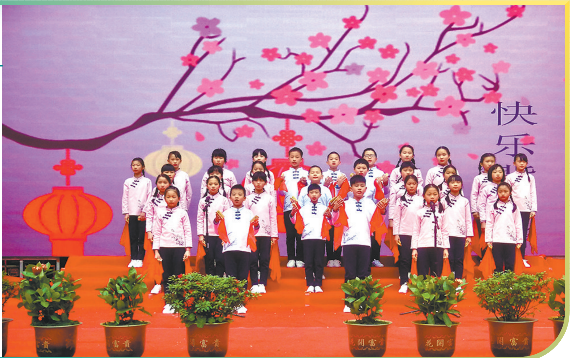
当地学校历年举办诗词活动

今年2月16日，五华县召开高质量发展暨重点项目推进大会，提出将争取非遗、文物、文艺创排等奖补资金，在基础上创新、在传承中创新，助力推动五华文艺文化事业高质量发展。