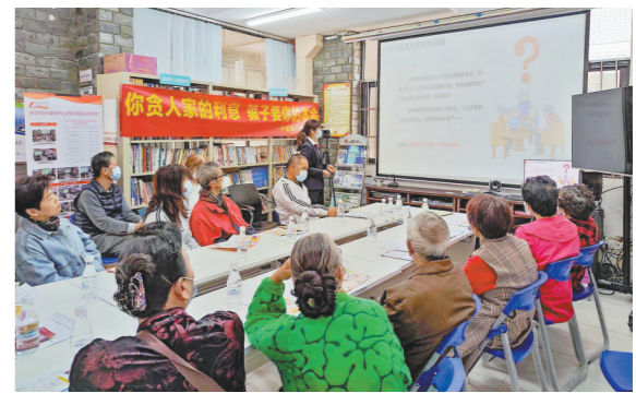
中国银行珠海分行深入春泽社区开展金融知识讲座