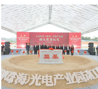
相关领导为力合科创(珠海)光电产业园奠基

深圳市力合科创股份有限公司(简称力合科创)是深圳清华大学研究院控股的高科技企业和A股上市公司，是深投控重要成员单位。力合科创以服务企业创新驱动发展、坚持高水平科技自立自强为己任，提供一流科创服务、培育一流科技企业，形成了特色鲜明的“科技创新服务+科技产业”业务模式，发挥产学研深度融合优势，批量转化科技成果、投资孵化硬科技企业，聚焦新材料新能源、数字经济等战略性新兴产业领域与未来产业，培育其中优质项目，形成公司的高科技产业体系，致力于让科技创新种子长成参天产业大树，成为中国科技成果产业化的全能冠军。