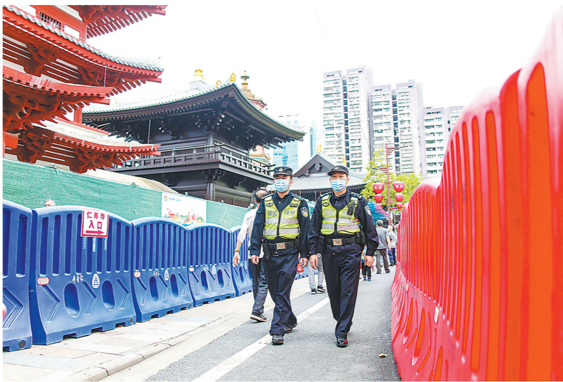
清明节期间,佛山警务人员在重点场所巡视维持秩序

值得一提的是,清明祭扫当日,顺德区开通14条免费公交线路,接送市民合计10.9万人次。据介绍,顺德共投入208辆车辆,免费接送市民前往大良飞鹅墓园、北涌祥宁园、陈村静安院和杏坛永安堂祭扫,共发出3504趟次。其中最多人搭乘的9条飞鹅专线,170辆公交车合共接送乘客约9.68万人次,平均每班搭载33人。