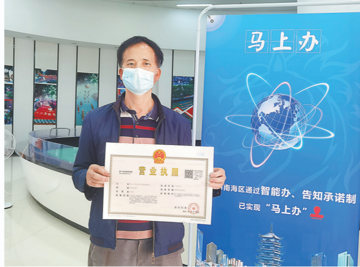
市民在南海区九江行政服务中心网办专区申报并成功领取餐饮类营业执照

此外,一季度新增各类企业1.08万户,占一季度市场主体新增量的28.52%;其中,新增制造业企业1065户,主要来自服装、家具、纺织、金属、塑