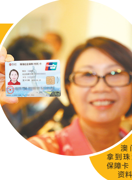
澳门居民拿到珠海社保卡资料图

珠海在全国首创“政银医”合作模式,通过积极协调各相关部门,在中国银行7家分行实现澳门居民办理参保缴费、办理社保卡等多项医保业务“一站办”。珠海还通过“互联网+医保”服务,打造港澳台居民“珠海社