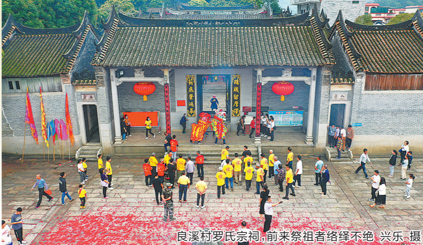
良溪村罗氏宗祠,前来祭祖者络绎不绝,兴乐、摄影

江门素有“中国侨都”美誉,祖籍江门五邑的530多万华侨华人及港澳同胞遍布全球145个国家和地区。每年清明节前后,大批乡亲都会从世界各地返乡祭祖。因疫情防控政策的优化调整,今年江门各地迎来了三年来最庞大的回乡人潮。