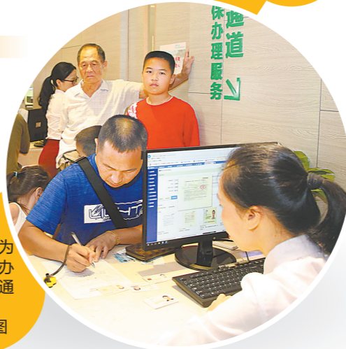
横琴为澳门居民办理医保开通绿色通道资料图