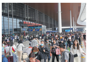
经港珠澳大桥珠海公路口岸出入境旅客数量连续刷新纪录

同时,作为“澳车北上”唯一指定的通行口岸,经港珠澳大桥珠海公路口岸“北上”通行车辆也出现快速增长。4月7日至10日,港珠澳大桥边检站共查验澳门单牌车1.4万辆次,占车辆出入境总数的45%。其中,4月9日,出入境澳门单牌车数量超过3900辆次,创下单日通关数量的最高纪录。