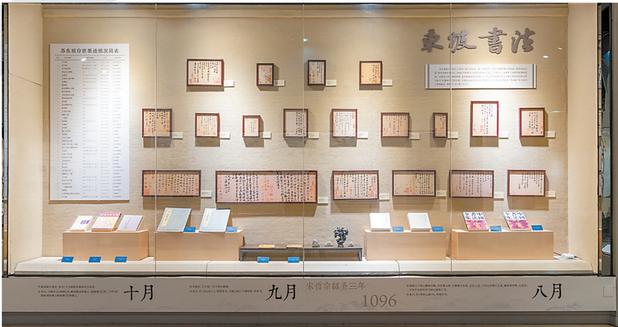
十月 九月 宋哲宗绍圣三年 1096 八月

如今，惠州书法气息绵延不绝，老中青传承有序。本土书法文化品牌不断擦亮，“秦晋生杯”书法大赛作为惠州书法界最高水平赛事，吸引近千位书法爱好者积极参与，成为粤港澳大湾区具有影响力的书法赛事之一。