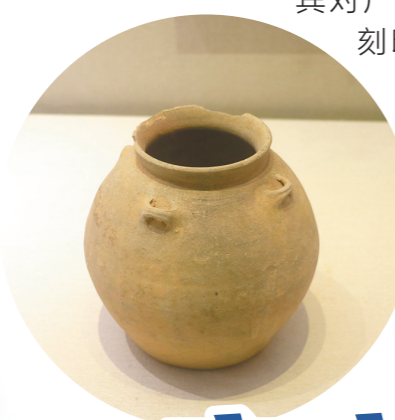
(汉代)素胎四系陶罐

四月中旬,“2023东亚文化之都·中国梅州活动年”开幕式系列活动举行,来自国内外的不少嘉宾对广东中国客家博物馆留下了深刻印象,纷纷表示通过这个“窗口”,更好地了解到客家人的历史与文化。本期客家文脉走进广东中国客家博物馆,感受千年客家文化的魅力。