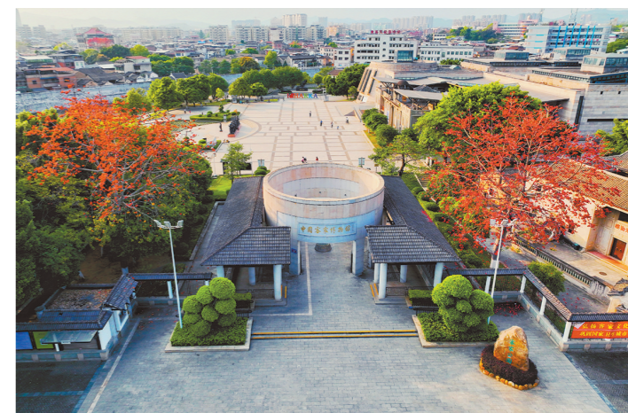
广东中国客家博物馆

梅州市华侨博物馆内设《海丝寻梦——梅州海外侨胞历史文化陈列》,从出洋篇、创业篇、传承篇、融合篇、故土篇、侨务篇六个部分,展示梅州海外侨胞艰苦奋斗的创业史和爱国爱乡的贡献史。