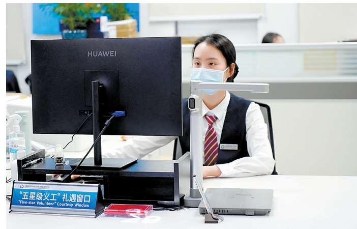
五星级义工礼遇窗口

近年来，龙岗区政务服务中心针对不同群体，不断优化政务服务方式，提升政务服务温度。如针对老年人群体推行了“适老八条”和“小龙帮办”；针对企业和个体工商户推出“一杯咖啡办成事”和“个转企到店办”，去年全区新增商事主体超10万户，位列全市第一；针对外国友人，安排专门外语人