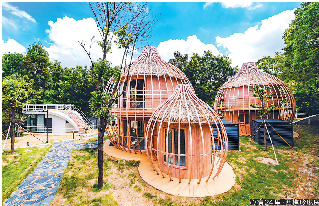
心宿24里·西樵玲珑房

著名诗人海子曾在诗中写道：“从明天起，做一个幸福的人，喂马，劈柴，周游世界；从明天起，关心粮食和蔬菜。我有一所房子，面朝大海，春暖花开。”周游世界的旅途中，一个理想的休憩场所，是游客远行时心灵的港湾，将旅途中的疲惫一扫而空。 近年来，随着文旅业的快速崛起和城市面貌的持续改善，酒店和民宿早已不止步于“居住”功能。在佛山，各大酒店和民宿“八仙过海、各显神通”，许多酒店和民宿或是玩起了跨界，将文化“搬”进来；或是打造场景，将意境“融”进去。现在请您同羊城晚报一起了解佛山的特色酒店与民宿。