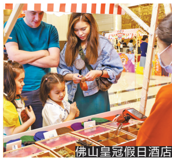
佛山皇冠假日酒店

前身是“佛山宾馆”的佛山市皇冠假日酒店坐落于禅城老城中心，祖庙商圈核心位置。“五一”黄金周期间，佛山（禅城）民俗文化旅游周、佛山祖庙庙会等文旅活动火热开展，为了让来自世界各地的游客更好地体验岭南文化魅力，佛山皇冠假日酒店热情地把“庙会”直接搬进了酒店。4月中下旬至5月初，该酒店在大堂推出“狮舞岭南，传奇佛山——三月三北帝诞·皇朝庙会”。