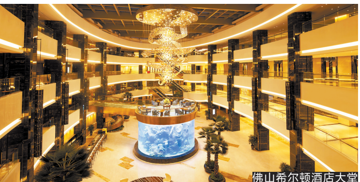
佛山希尔顿酒店大堂

盘鱼；4月30日蓝鳍金枪鱼开鱼秀；5月1日东头烧猪秀；5月2日原汁鲍鱼扣饭；5月3日京味片皮鸭，都值得广大游客朋友打卡品尝。酒店安全和卫生一直是旅客关注的重点，希尔顿向来注重安全与卫生。在2020年4月28日，希尔顿宣布在全球希尔顿酒店推出Hilton CleanStay“希尔顿清洁无忧住”，旨在推广行业领先的清洁和消毒标准。目前，全球希尔顿酒店已经采用医院级清洁产品以及升级运营操作规范。