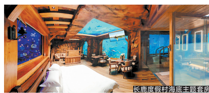
长鹿度假村海底主题套房

今年五一，佛山顺德长鹿旅游休闲博园策划了“第六届乡村音乐节”活动，为来自五湖四海的游客开启一段乡村音乐休闲之旅，“舞颂劳动，热情桑巴”“欢乐音乐大巡游”“牛仔马车，吉他演唱”“水乡演奏·渔歌对唱”“荧光音乐派对”等丰富的音乐主题活动让游客乐此不疲！云集明星、DJ、MC现场打碟、电音狂欢、荧光彩绘，给游客带来一场音乐的交流盛会。