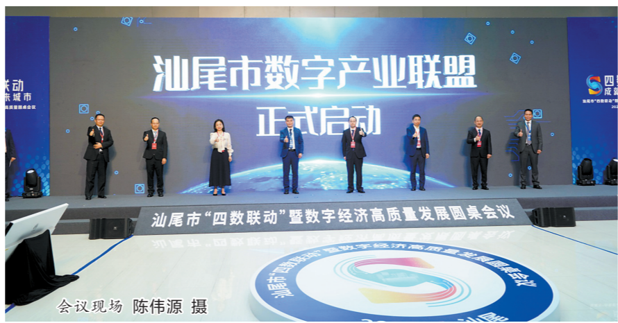
会议现场