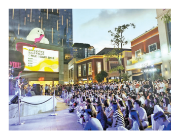
“ONCE AGAIN”乐队在富华里演出,粤语金曲引发全场大合唱

专业讲解,音乐大师现场教学。为进一步满足市民群众对音乐演唱专业讲解的需求,活动特别邀请著名男高音歌唱家、国家一级演员周琦,在珠海