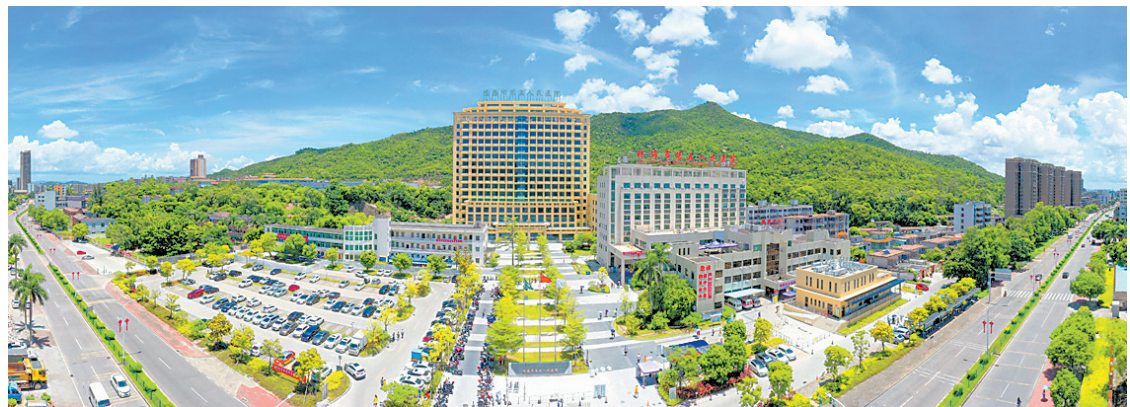
珠海市第五人民医院

患者流出多、医疗资源相对薄弱,长期触动珠海西部居民的“神经”,东西部医疗卫生服务发展不均衡,是珠海长期以来面临的困境。2023年全国卫生健康工作会议提出,要把医疗卫生服务能力建设放在更加突出的位置,促进优质医疗资源扩容下沉和区域均衡布局,这项工作也是党和政府的中心工作。解决优质医疗资源总体上供给不足、分布不均衡的发展短板,更好地满足人民群众看病就医需求,珠海如何探索出一条资源集约利用、优化配置、合理发展的“珠海道路”?