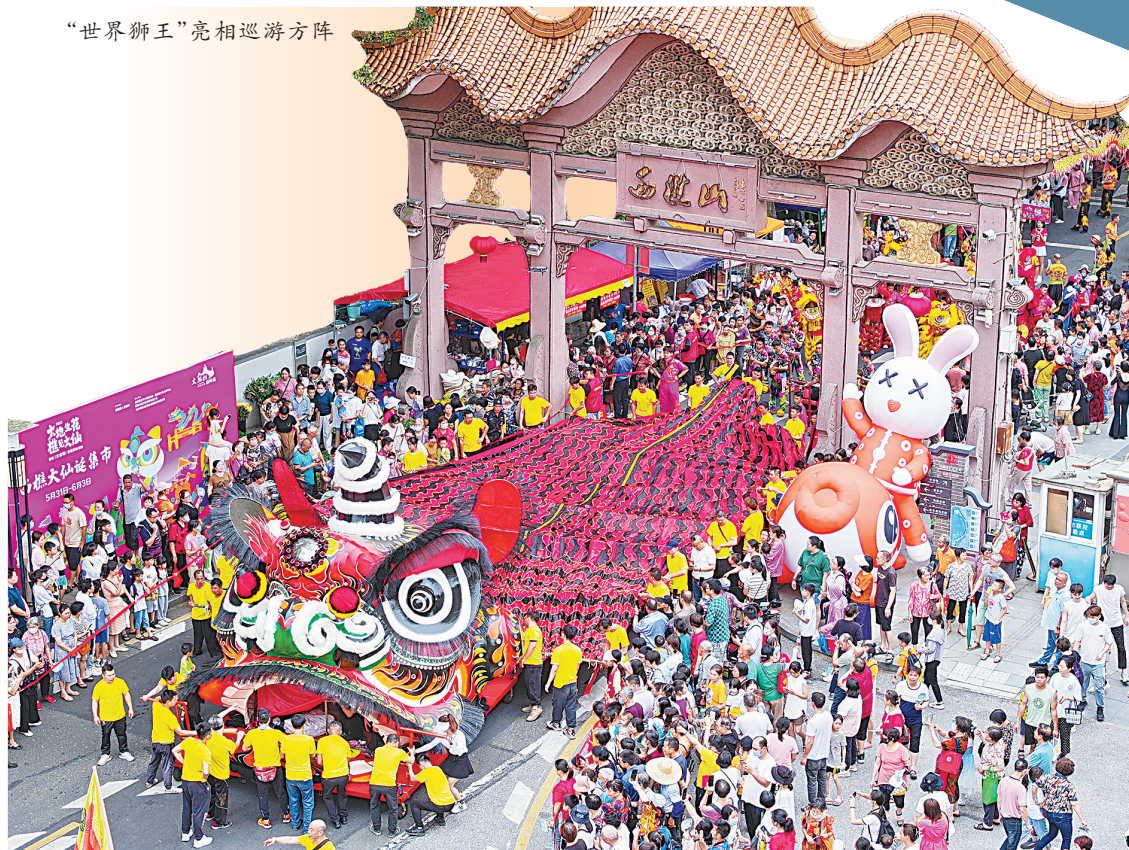
“世界狮王”亮相巡游方阵