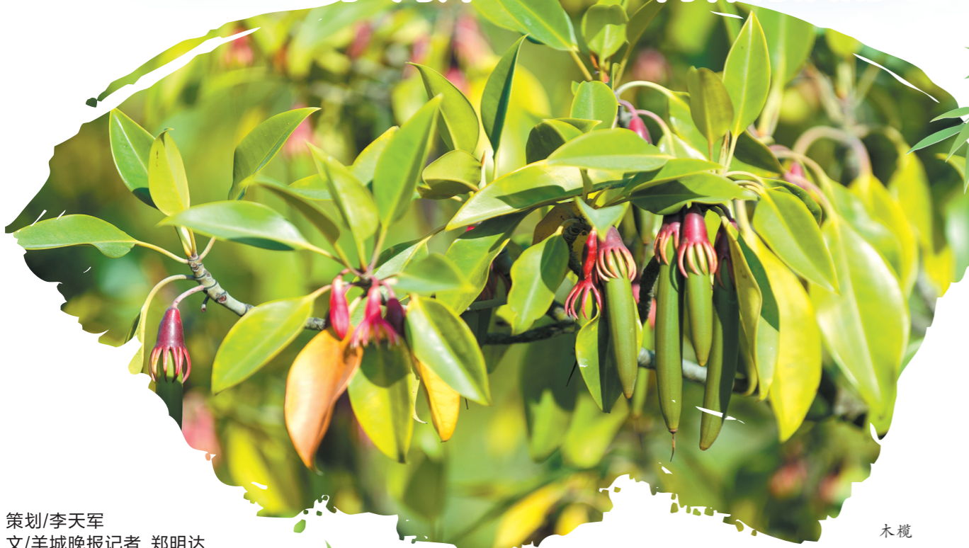
红树林湿地生态修复成效显著

红树林被认为是地球上生物多样性和生产力最高的海洋生态系统之一,与珊瑚礁、海草床并称为地球三大海洋生态系统。尤其是红树林,近年来逐渐成为国际生态保护的焦点。