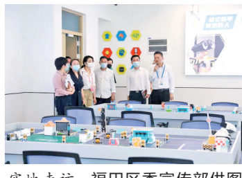
实地走访

此次巡礼活动,福田区面向大众对近年的优质示范民生工程进行集中展示,全面展现辖区在不同工程上的为民初心与工作的诚意,而活动启动地皇岗创新实验学校,本身就是福田教育在城