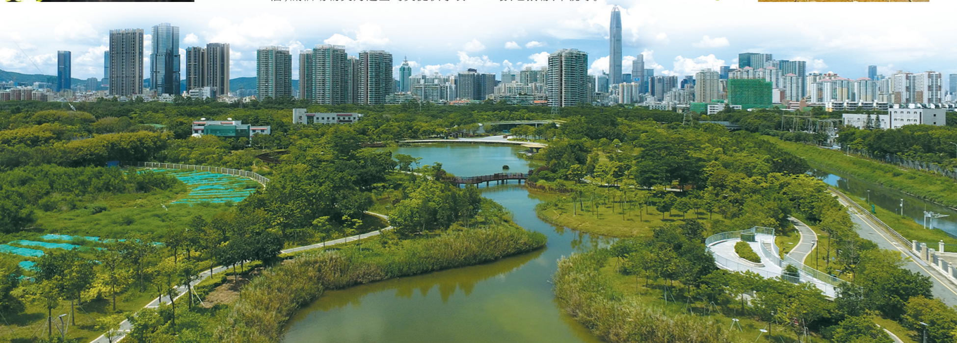
福田红树林生态公园