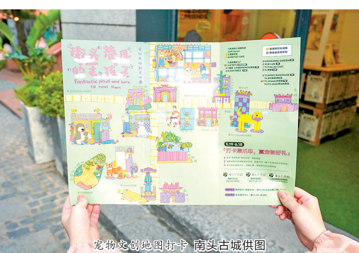
宠物文创地图打卡

树一帜，借助文博会平台培育和获得更多的客户，展现中国青年品牌的文化实力。 与此同时，围绕宠物文创经济，南头古城在文博会期间将持续推出宠物文创地图打卡、流浪动物领养日、爱宠导览日等活动以促进宠物友好的街区氛围，增强公众对宠物文创品牌的关注，通过上述活动，南头古城希望用更生动的活动、更创意的跨界、更新颖的形式让观众们能感受、参与、体验不一样的文博会。 南头古城连续三届作为文博会分会场之一，是一个历史文化基底丰富、文化创意业态多