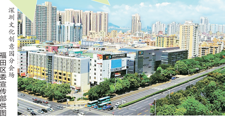
深圳文化创意园分会场

6月的深圳即将迎来重量级展会。作为中国唯一的国家级、国际化、综合性文化产业展会，第十九届中国(深圳)国际文化产业博览交易会将于6月7日在深圳国际会展中心拉开序幕。