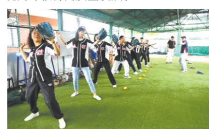
广州体育学院马克思主义学院组织思政课教师走进棒垒球教研室

暨南大学党委书记林如鹏说：“暨南大学将认真学习贯彻习近平总书记重要讲话精神，积极推进‘双一流’与高水平大学建设，不断强化优势、凸显特色、加强创新、完善制度，不断提升服务国家、服务社会的能力和水平，努力实现高等教育高质量发展。”