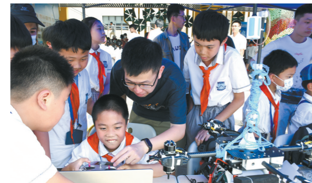
广东工业大学创客社同学走进小学