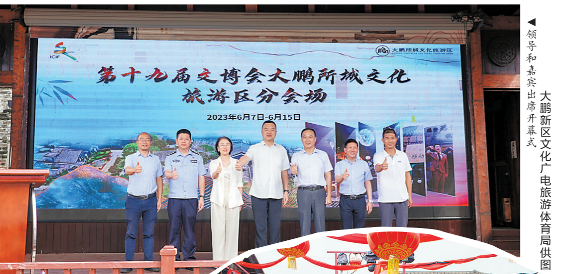
领导和嘉宾出席开幕式

活动现场,社工与企业负责人进行了互动问答,提醒负责人在日常生活中警惕“伪装毒品”,同时发放宣传册,让企业自行组织讲解,扩大禁毒宣传面,提高禁毒意识。(李薇 李德美 罗睿楠)