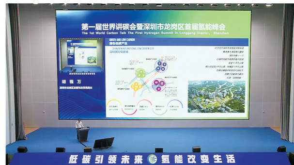
开幕式现场

6月7日上午,第一届世界讲学会暨深圳市龙岗区首届氢能峰会(以下简称“讲学会”)正式开幕。本次峰会以“低碳引领未来,氢能改变生活”为主题,于6月7日至8日在深圳国际低碳城举办。