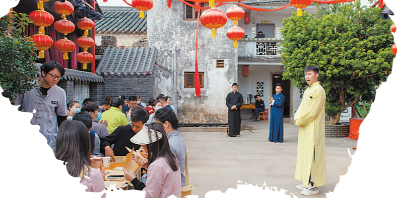
《鹏城谍影》红色沉浸式体验剧场

第十九届文博会大鹏所城文化旅游区分会场于6月7日开幕。本次文博会分会场由大鹏新区文化广电旅游体育局主办,深圳华侨城鹏城发展有限公司承办。本次大鹏所城文博会以“非遗与科技”为主题,为观众带来了一系列精彩活动,全方位挖掘所城文化内涵,助力增强大鹏文化产业发展的活力。