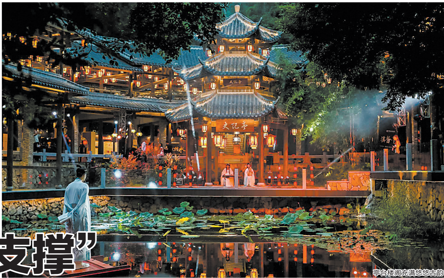
亭台楼阁充满悠悠古韵

一直以来,吉华街道将文化建设摆在突出位置,文化与产业交融互动、融合发展,成为一起“唱戏”的主角。这背后,映照着吉华街道在坚持守正创新,深度激发文化创新创造活力,推动文化自信自强上的一路高歌。