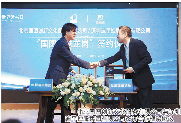
北京国图创新文化服务有限公司与深圳迪平控股集团有限公司签约合作框架协议

己的文艺家园,解锁了全新的生活方式。它将阅读、旅行、社交与教育融为一体,打造都市人的文艺家园。它的建设也是吉华街道近年来文化事业蓬勃发展的缩影。