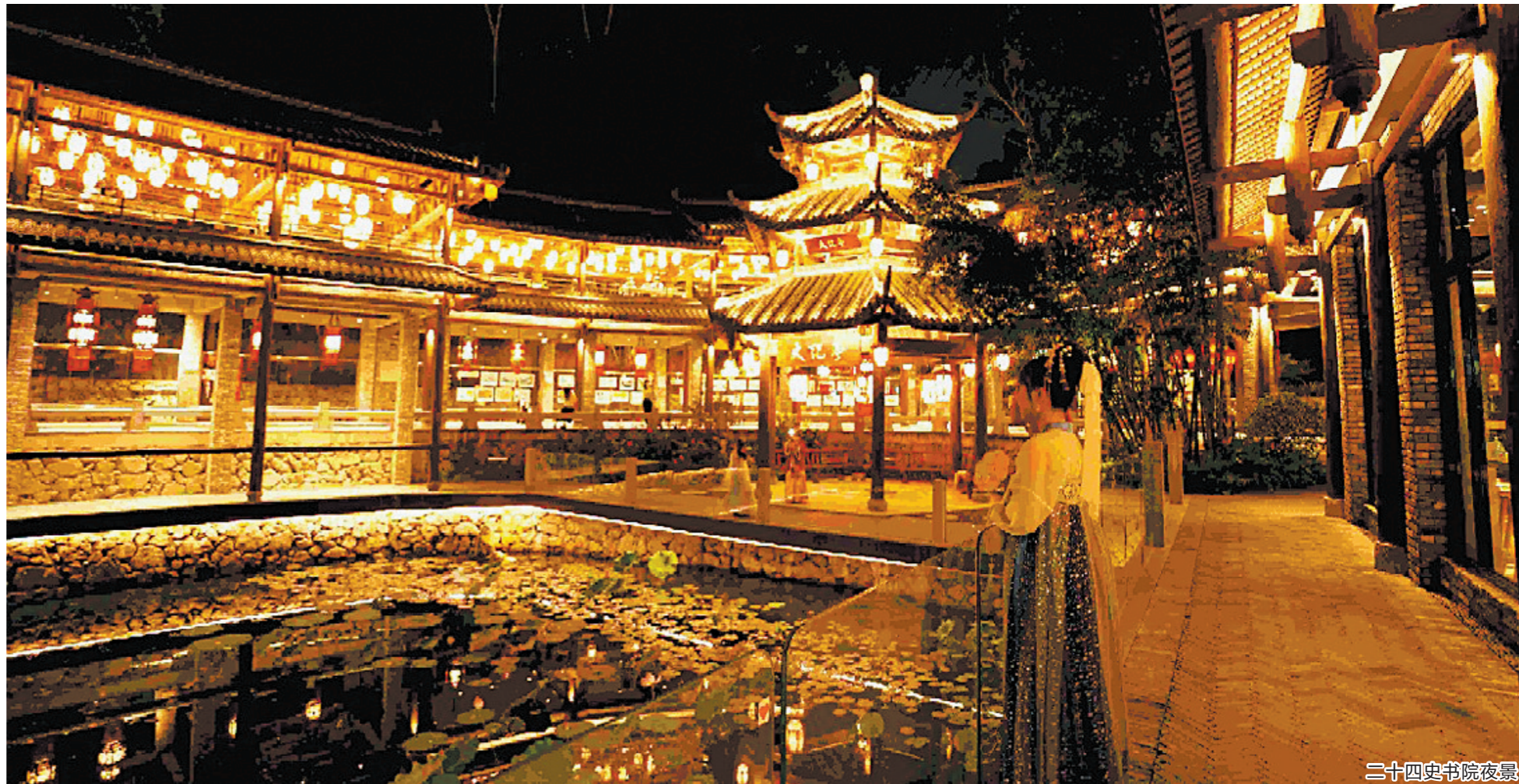
二十四史书院夜景

此外,吉华街道搭建高校与本地农村文化交流互动平台,联合深圳技术大学开展“吉华范式”艺术兴村,引入大学资源对街道11个“城中村”进行文化空间设计研究,为深圳创新“城改新”路径探路。