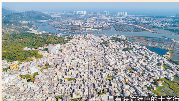
具有海防特色的十字街

明清时期,惠州作为广东海防东路的中枢,不仅是对抗倭寇和海盗的前沿,更是维护海洋主权的重要保障。惠州现存有明代所城遗址一处、明代烽火台遗址三处、清代炮台遗址三处,都生动体现了惠州千年古城文化中的宝贵海洋基因。