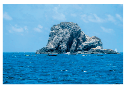
▲针头岩 ▲白马窑址群出土瓷碗