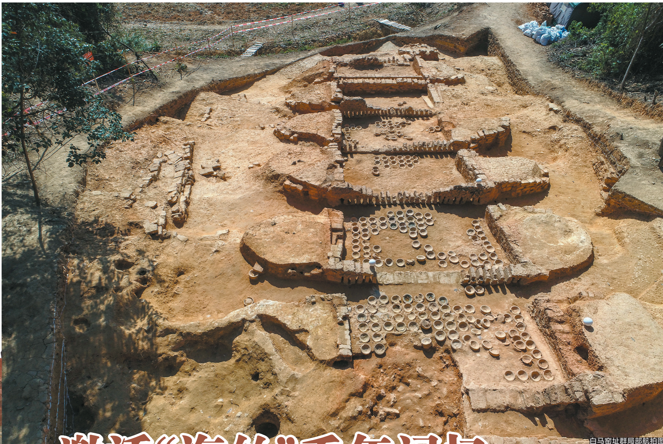
白马窑址群局部航拍图

悠久的历史孕育了以白瓷窑、白马窑为代表的惠州外销瓷窑场,惠州现留存的卫所、烽火台和炮台等丰富海防文化遗产同样在诉说这段历史。近日,记者从惠州市文广旅体局获悉,惠州将以举办“海丝联盟会议”为契机,深入实施“3+N”海丝文化提档升级工程,以白马窑保护利用为引擎,助推惠州“海丝申遗”和海洋文化保护全面开展。