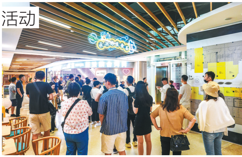
澳门餐饮行业协会考察横琴商圈

合作区商事服务局相关负责人称,下一步,商事服务局将持续通过政策宣讲会、实地考察、线上活动等形式开展宣传,加强对澳门餐饮业界推介合作区。其中,7月18日、19日将分别面向澳门餐饮业联合商会会员企业、澳门美食同业联合商会会员企业再举行2场政策宣讲会暨商圈考察活动,欢迎业界踊跃参加。