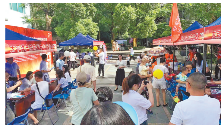
工作人员向社会公众宣传保险知识、普及保险理念

珠海市各机构还通过各自微信视频号、抖音、微博等官方微博号进行形式灵活、内容多样的直播活动,传递行业正能量。(艾琳)