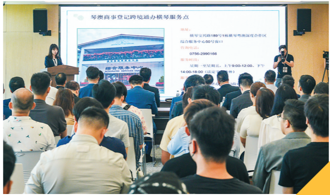
合作区相关部门向澳门企业介绍情况