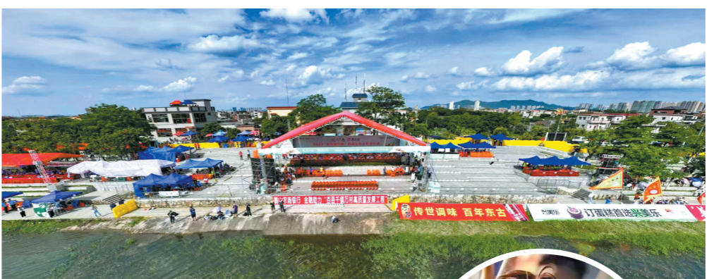
建设中的鹤山龙舟公园