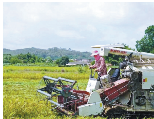
艳阳高照，农机在稻田中驰骋

记者13日从江门市农业农村局及各地农业农村部门获悉，作为粤港澳大湾区重要“米袋子”，江门今年夏粮收割进行得如火如荼。据悉，今年江门市早造播种面积为8.346万公顷，预计7月中下旬即可完成全部收割工作，产量将与去年持平。