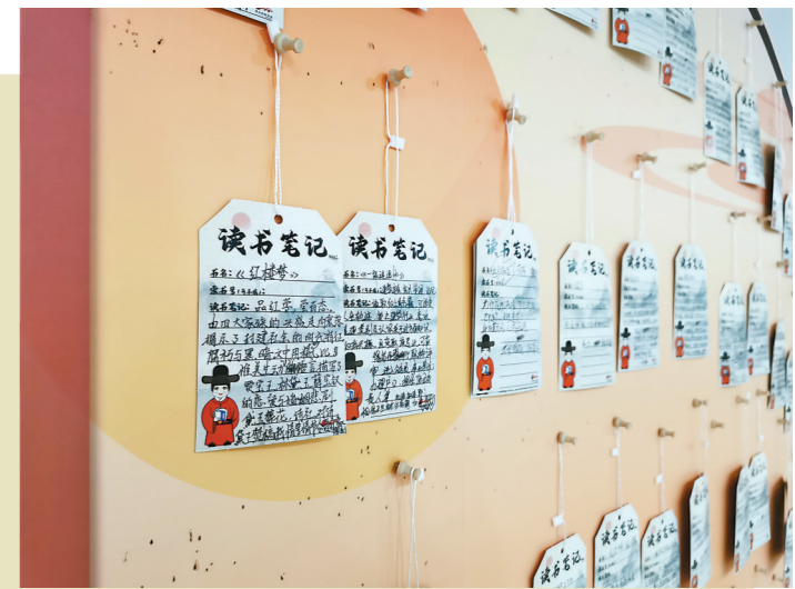
读者在角落留下他们阅读后的思考