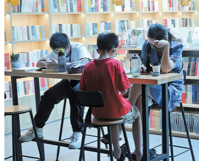
“千灯妙汇”书香夜市