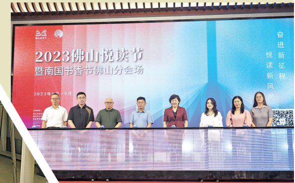
2023佛山悦读节暨南国书香节佛山分会场启动

有一个关于作家钱锺书的趣味故事，在书迷圈流传许久。有一次，一位美国读者对钱锺书的作品《围城》情有独钟，希望能亲自拜访这位才子。然而，钱锺书以幽默的口吻婉拒了她的请求，“假如你吃了个鸡蛋，觉得不错，何必非要认识那下蛋的母鸡呢？”