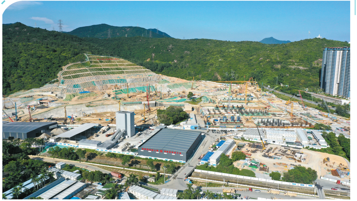
轨道8号线溪涌站施工现场

可以预计,随着轨道8号线、32号线、深惠城际支线等轨道交通项目加速推进,横头双湾等城市更新项目接连实施,深圳海洋大学(一期)、人大附中深圳学校高中部扩建、深圳市大鹏新区人民医院等项目开工建设,葵涌必将迎来美丽蝶变,大鹏新区高质量中心城区指日可待。