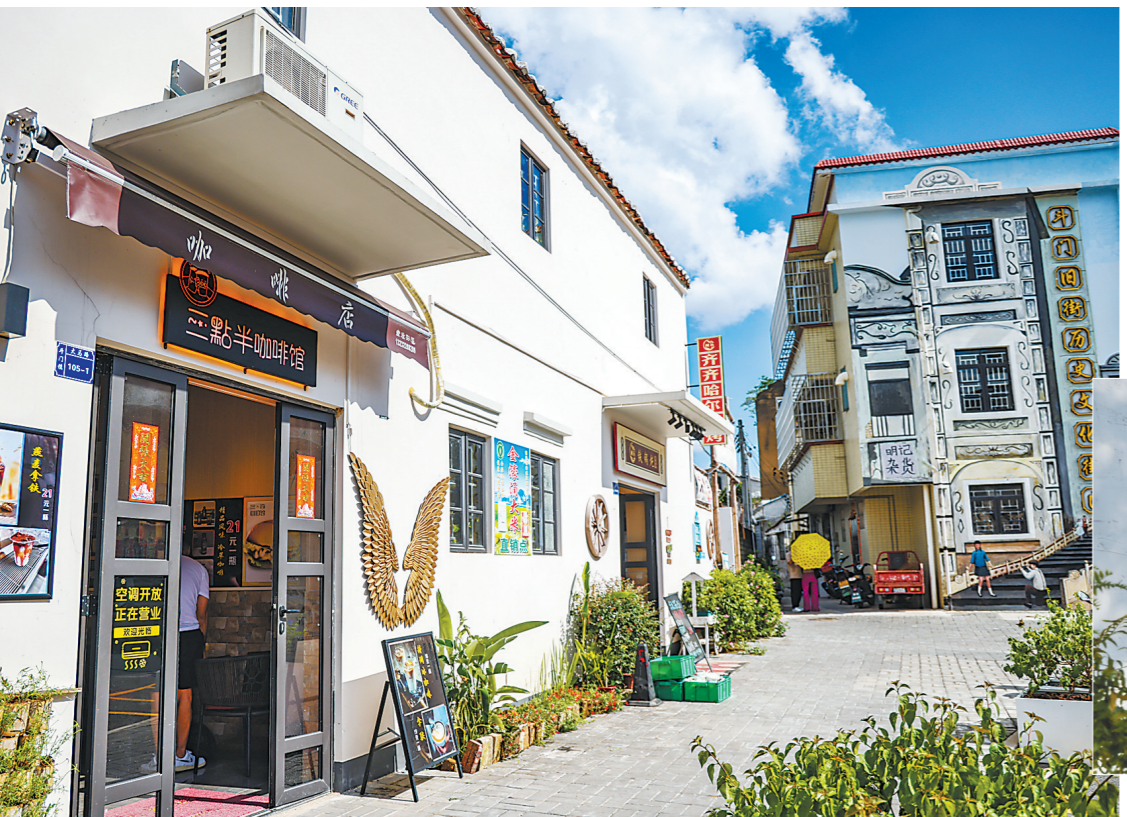
百年历史的老街焕发新生机