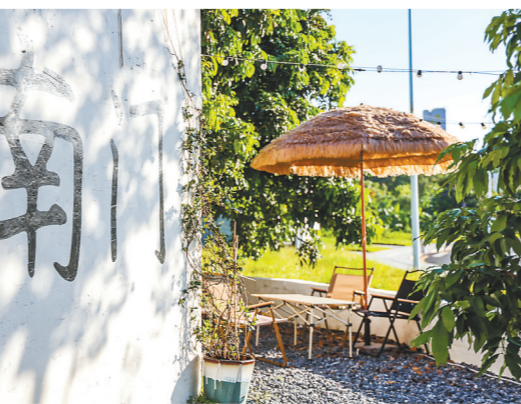
南门村的乡村咖啡馆