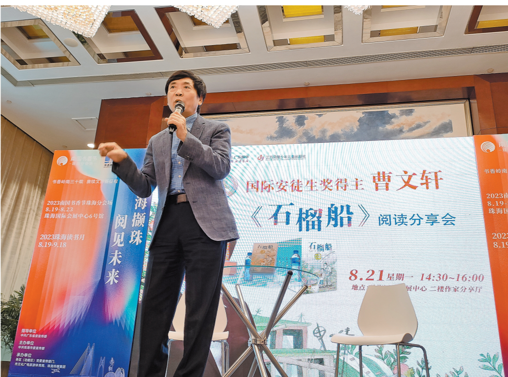
2023南国书香节现场，曹文轩在给孩子们传授写作技巧