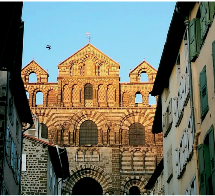
法国 Le puy 古城