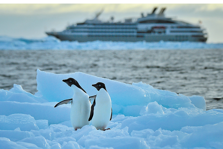
邂逅南极精灵帝企鹅

船上弹钢琴，我马上突发奇想，为什么不找他帮我找一支曲子配发到我拍摄的视频上？钢琴师想了想，就即兴给我奏了一支曲子。