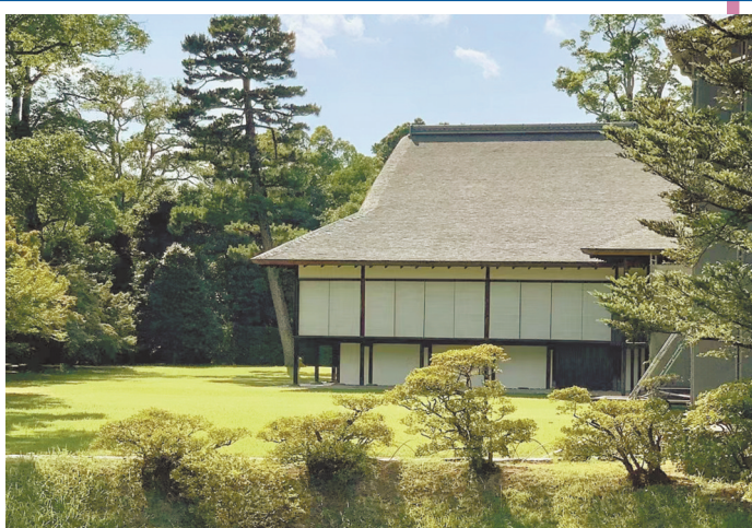
京都桂宫是近现代日本建筑美学之典范