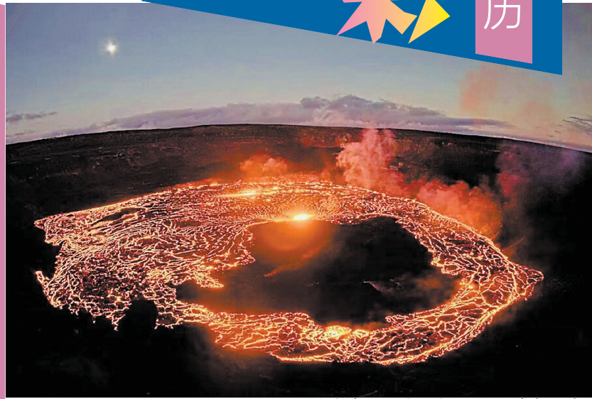
夏威夷岛上的基拉韦厄火山