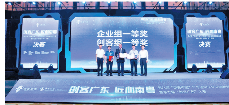
获奖选手上台领奖

据悉,“创客广东”大赛自2017年开办以来,累计吸引逾两万个项目参赛,对接龙头企业参与投资机构逾千家,有超过80%的项目在广东这片创新沃土实现成果转化。通过举办本次大赛,促进大中小企业融通发展,推动中小微企业创新创业与转型升级,推动创新链产业链资金链人才链深度融合,助力在新一轮科技革命和产业变革中抢占先机,塑造和提升广东在新发展格局中的战略优势。