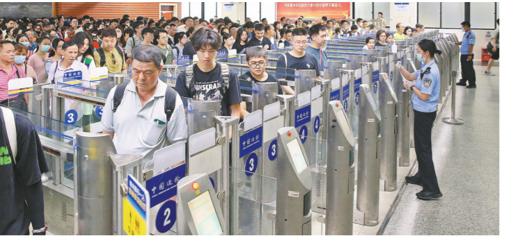
拱北口岸节前迎来客流高峰

在出入境车辆方面,今年以来,珠海边检共查验出入境车辆530.43万辆次,日均车流量近2万辆次,其中“港车北上”“澳车北上”出入境车流量已达37.75万辆次。“进入9月份以来,截至25日,港珠澳大桥珠海公路口岸已有12天单日车流破万。中秋国庆假期,口岸出入境客流车流有望再创新高,预计单日最高客流量达8万人次,单日最高车流达1.4万辆次。”港珠澳大桥边检站相关负责人表示。