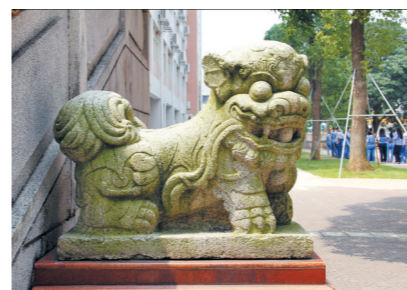
和风中学校园一景