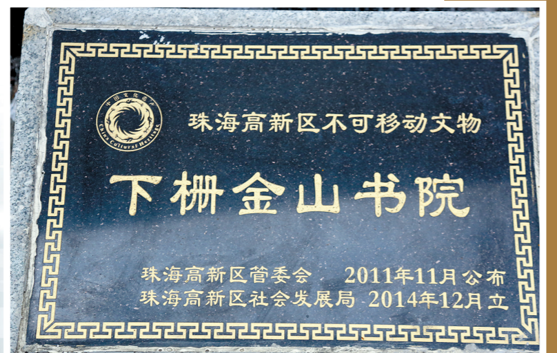
金山书院被列为不可移动文物