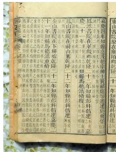
香山县志记载凤山书院创建时间

“自设县立学校”之举,揭开了香山教育的序幕。南宋绍兴二十二年(1152年),香山镇提升为香山县,香山县由此登上了历史舞台。但根据《珠海简史》记载,香山县在南宋绍兴二十二年(1152年)设立后,被朝廷列为下等县,南宋时全县仅建有儒学一所(注:在我国古代,京师有国子监、府、州、县有儒学,乡村有学塾),义塾与私塾均极其有限。而毗邻的番禺、顺德等县,在教育上已经有了很大的发展。到了元朝,由于香山居民均属于南宋遗民,等列第四,社会地位最低,科考、任职受到严格限制。