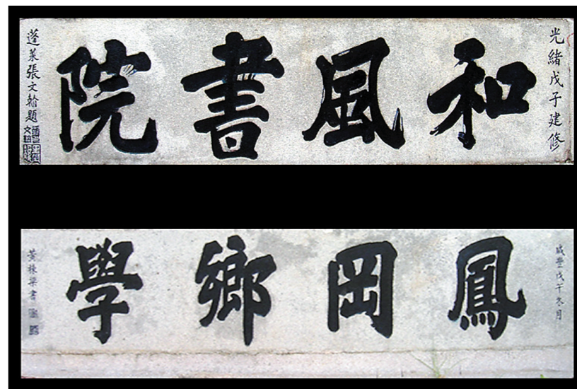
古校牌匾