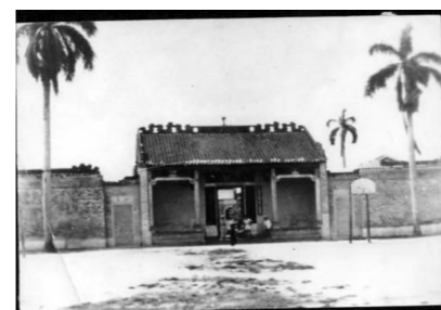
凤山书院大门