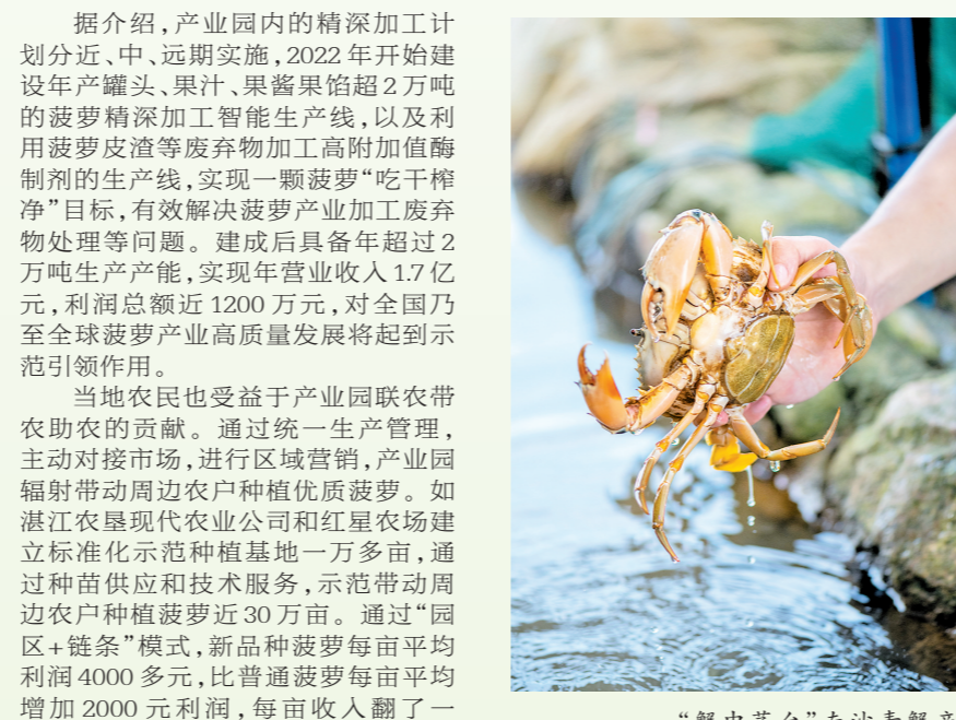
“蟹中茅台”南沙青蟹产自南沙区渔业产业园