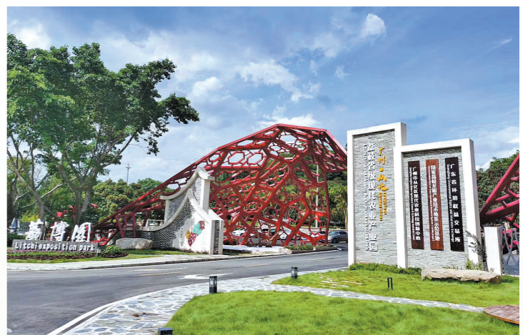
从化区荔枝省级现代农业产业园

业振兴的首要任务。如何一手牵起城市繁荣,一手带动乡村振兴?羊城晚报记者从广州市农业农村局了解到,近年来广州市通过建成一批特色产业园,有力带动了都市现代农业产业发展。