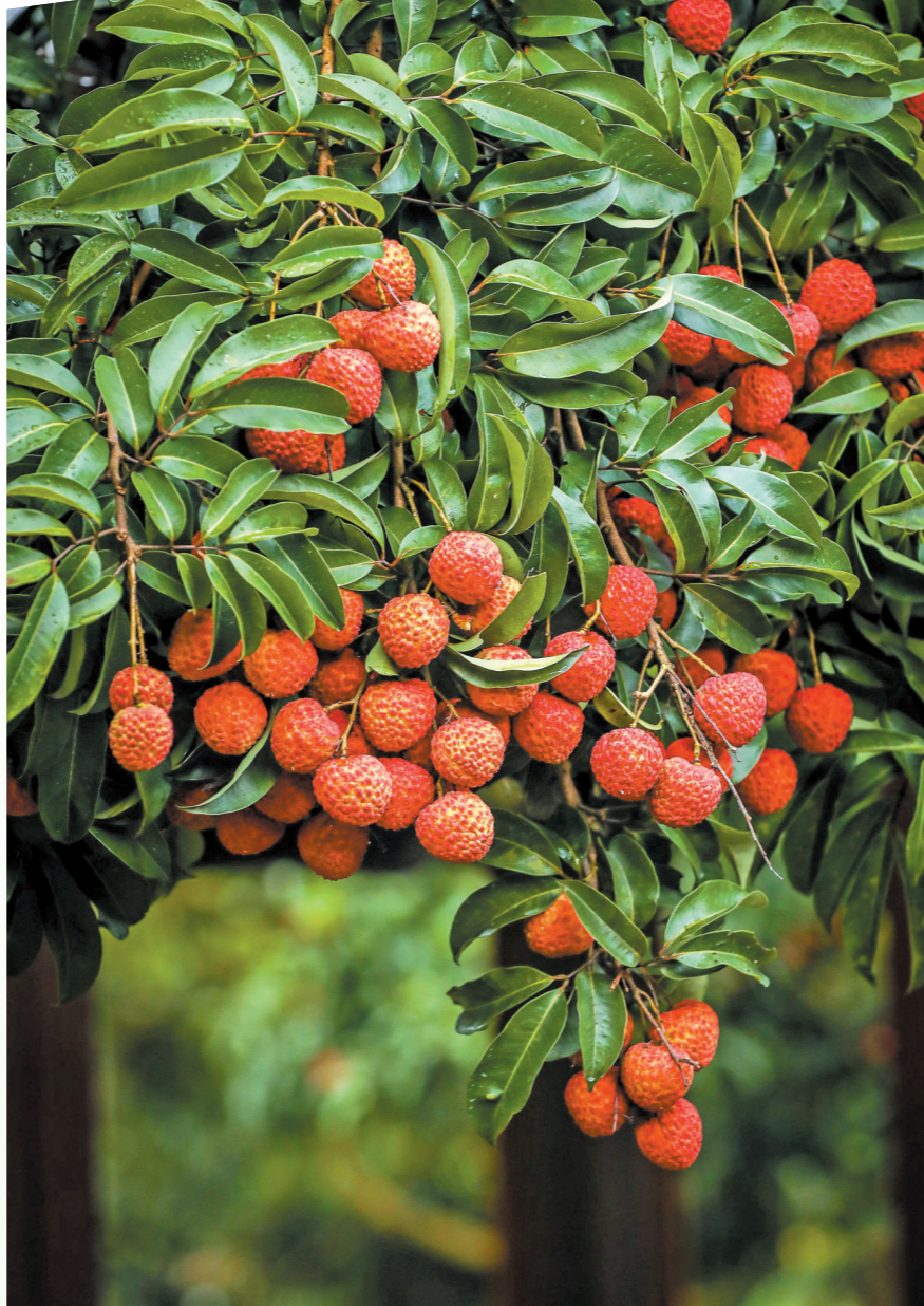
从化荔枝今年增产又增收(资料图)

在从化区花卉产业园,通过创新土地入股、协会带动个体经济等模式,带动3.8万名农民参与花卉产业,与合作社或龙头企业建立利益联结机制的农户比重达到70%。空港花世界产业园招聘村民入企就业,传授盆景手艺,人均月收入超过5000元。