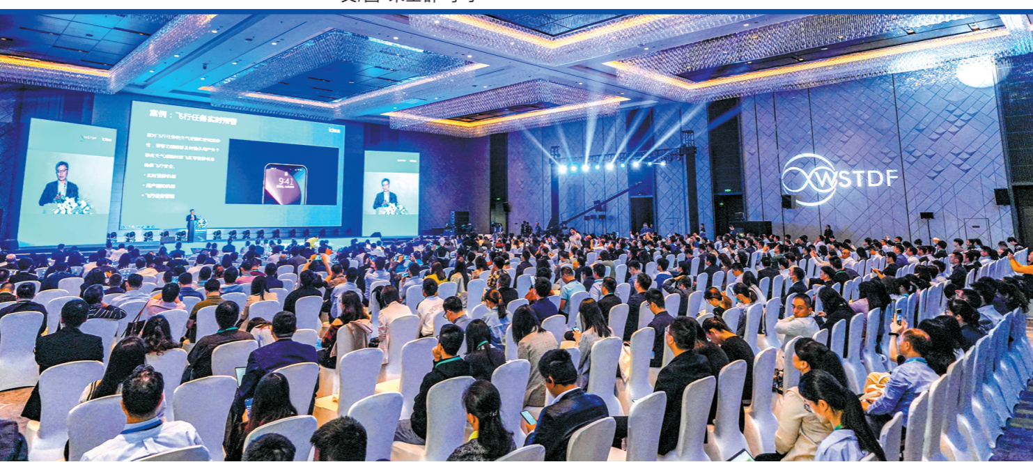
世界低空经济论坛举办了多场主题演讲及高端对话

11月23日，世界低空经济论坛在深圳举行，本届论坛以“科技赋能发展，共谋湾区未来”为主题，通过多场主题演讲及高端对话，体现深圳加速布局“天空之城”、推动低空经济发展的先行示范意义。本次论坛是第五届世界科技与发展论坛的平行论坛，由深圳市交通运输局和粤港澳大湾区数字经济研究院承办，龙岗区、龙华区政府、深圳市低空经济产业协会协办，共15家研究机构、300余家企业参会。