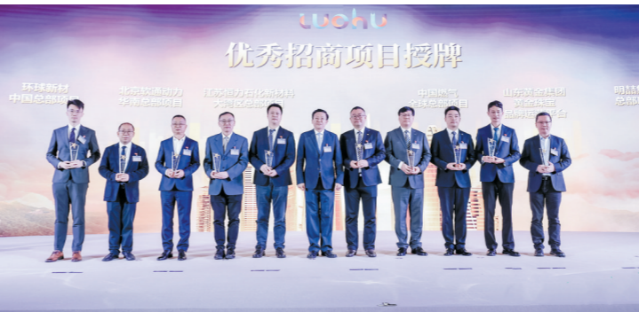
罗湖招商大会现场

羊城晚报讯 记者李晓明、通讯员欧东勇报道：11月23日，2023年可持续建筑环境亚太地区会议(SBE23 Asia-Pacific)在深圳龙岗区天安云谷开幕。本次会议聚焦建筑领域“碳达峰、碳中和”实施路径，涵盖碳中和与气候适应性、近零碳城市、近零能耗建筑、建筑低碳方法与工具、市场与政策、绿色建筑高质量发展等议题。 据悉，“可持续建筑环境系列会议”被视为现今可持续建筑及建造业界中最具影响力的国际盛会，由国际可持续建筑环境促进会、国际建筑研究与创新理事会、国际咨询工程师联合会、联合国环境规划署四个国际机构于2000年始创，三年一周期。SBE23 Asia-Pacific首次举办辐射亚太地区的区域会议，备受国内国际行业瞩目。 本次大会由深圳市人民政府主办，汇集了来自中国、新加坡、印度尼西亚、马来西亚、日本、德国、英国、澳大利亚、瑞士、加拿大等海内外绿色建筑与可持续建筑环境领域的院士专家、资深学者、行业领袖、青年菁英，共同交流最新科技成果、发展趋势、成功案例。 此次大会除主论坛外，还同期举办“中国-瑞士-德国零碳发展与合作论坛”“中英交流会——建筑业迈向近零”“第三届热带及亚热带地区立体绿化大会”三大平行会议，以及十五场分论坛。 可持续建筑环境会议组委会授权深圳举办首次亚太地区会议，借此契机，会议上举行“全球可持续建筑环境亚太地区会议深圳倡议”发布仪式，全体与会代表以“发展绿色建筑”“促进人与自然和谐共生”“推进‘净零地球’运动”五条倡议，呼吁共商共建绿色低碳智慧共同体，推动实现“地球村”的可持续发展，共筑美丽地球家园。