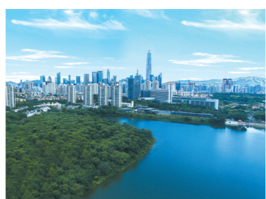
天健天骄峯玺远眺景观