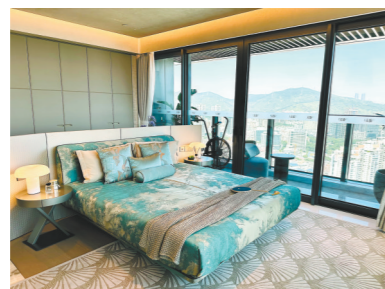
天健天骄峯玺无遮挡视野