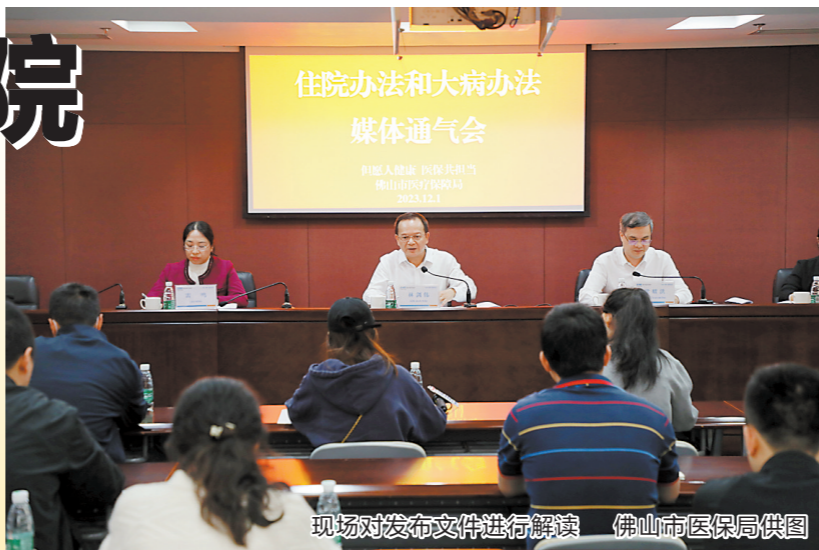
现场对发布文件进行解读

《大病办法》进行解读。 据介绍，自2019年成立以来，佛山市医保局在创新“佛医保”、罕见病医疗救助、DRG付费改革国家试点、医保医药服务评价全覆盖、“双通道”医药保障制度等多项重点改革中走在全省前列，改革成果惠及广大市民、参保人和定点医药机构。