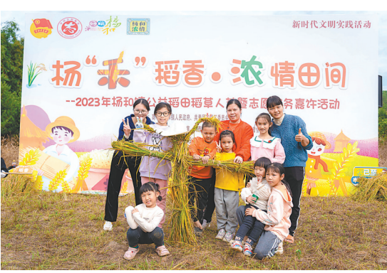
借助公益稻田开展亲子体验活动

4月、7月,项目分别推出春耕、夏收两期亲子体验活动,认领者通过参与播种插秧、收割打谷等农耕活动和稻谷美术手工,亲近土地,关注自然,了解四时农事,体验耕种乐趣。