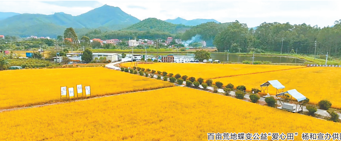
百亩荒地蝶变公益“爱心田”

羊城晚报讯 记者吴泳、通讯员谢婷婷报道: 春种一粒粟,秋收万颗子。2023年,佛山市高明区杨和镇启动公益稻田项目,将镇内约100亩连片撂荒农田复垦改造,对连片集中农田进行项目统一规划,成功盘活“沉睡”荒地,并在收割季迎来总产量超6万斤的大丰收,以“农旅+公益”融合创新形式,深入推进“百千万工程”。