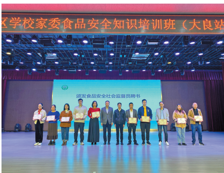
为家长颁发食品安全社会监督员聘书

目前顺德所有学校食堂、学校集体用餐配送单位已实现“互联网+明厨亮灶”建设和食品溯源管理全覆盖,实现“可视化、可追溯”监督,有力推动校园食品安全社会共治。下一阶段,市场监管部门将联合教育等部门,持续开展校园食品安全监管及