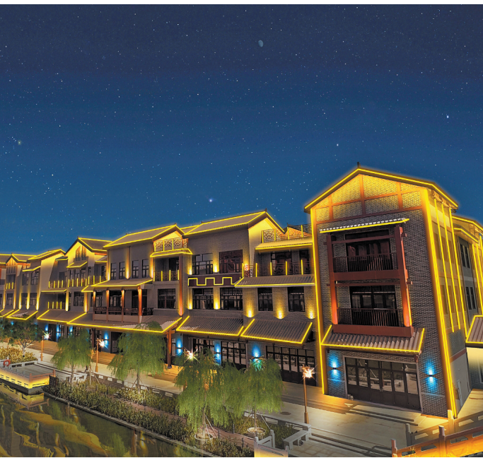
听音湖樵乐坊项目效果图

据介绍,西樵作为文旅重镇,正全力建设佛山西樵岭南文旅产业集聚区,推进文旅产业提质升级。听音湖片区作为佛山西樵岭南文旅产业集聚区的核心区,已有希尔顿欢朋酒店、观心小镇等酒店及商业配套,佛山广东千古情景区也将开业。听音湖樵乐坊项目的投资运营,将进一步丰富佛山广东千古情景区开业后的文旅配套,为游客在吃、住、行、游、购、娱等方面提供丰富选择;将使听音湖片区的文旅业态更加多元,进一步提升片区的夜间文化和旅游消费内涵。