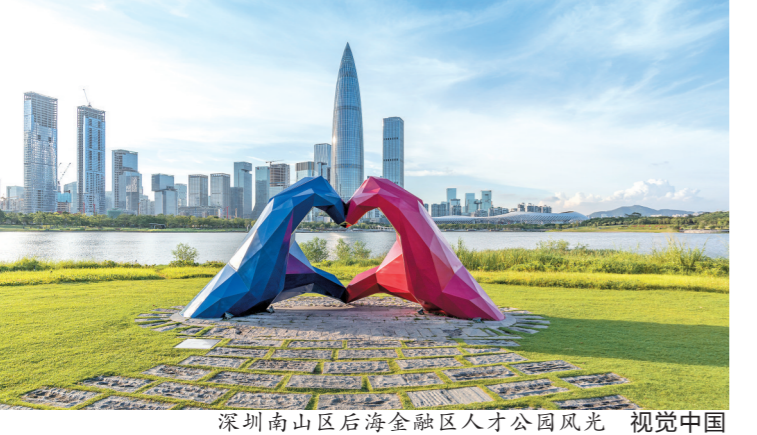
深圳南山区后海金融区人才公园风光