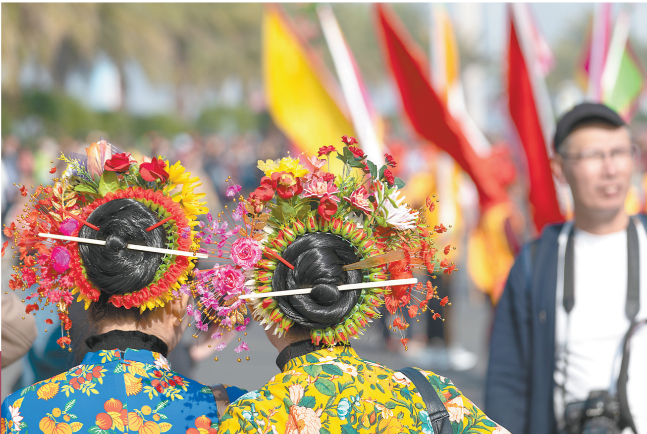
去泉州蟠埔村做一回簪花女

有关方面为“蓝湖”重新开放设置条件，比如疏散计划完备，发生紧急情况时能在两小时内迅速疏散人流；游客必须乘坐指定客车抵离，不得自驾；调整开放时间等。