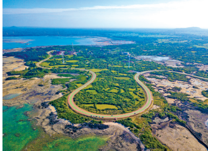
海南环岛旅游公路

12月18日，海南环岛旅游公路通车仪式在海南省海口市举行。海南环岛旅游公路是建设海南自贸港和创建国际旅游消费中心的先导性重大基础设施项目。