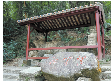
鲍俊与文人名仕相会雅聚之所“惜字社”遗址

鲍俊是有意识地规划石溪的人文景观，而不仅仅是舒散个人怀抱情悦性而已。 书圣王羲之的传世佳作《兰亭集序》，让人们至今神往浙江绍兴的兰亭，鲍俊不仅有意地将石溪比拟罗浮，他甚至将石溪与名垂千古的绍兴兰亭相提并论。道光三十年（1850年）三月上巳日，以鲍俊为代表的一批文人齐聚石溪，举行了一场别开生面的“亦兰亭”活动。这次“亦兰亭”雅集，灵感直接来源于东晋的永和之会，主题围绕王羲之《兰亭序》而展开。今石溪有“亦兰亭”的柱石遗迹，而且一石柱上刻有一上联：“昔之人娱情水曲寄兴亭阴因觞咏自畅天怀岂同遗迹”，落款云：“集楔字题亦兰亭”，可惜下联尚未发现。 当年名士聚于石溪，豪饮放歌赋诗怀古，留下累累墨笔石刻，因年代久远，现存仅三十余处，以行书为主，也见楷书和隶书。大者如“石溪”“鹭”等近一米大，小则几厘米见方。石溪摩崖石刻群大多取意于环境、石貌，如“茂林修竹”“樵径”等，游人至此如临一座书法展览馆，趣味横生。