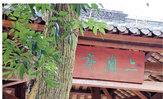
鲍俊及其书朋诗友在石溪创建“亦兰亭”

“非徒书法之工也，君为诗诗工，为词词工，为画画工，为制艺（八股文），制艺尤工。”岭南著名学者、“粤东三子”之一的张维屏曾如此评价友人鲍俊。 诗词书画样样精通的“岭南大才子”鲍俊不仅一度成为香山文坛领袖，更是取得了有史以来珠海科举考试最好成绩，试卷获道光皇帝御批“书冠全场”。辞官回乡后，他的书法真迹遍及广东及周边省份，乃至港澳地区的庙宇祠堂都有他的真迹，更是在珠海石溪效仿兰亭雅集，留下摩崖石刻的文化瑰宝。 珠海文史专家何志毅长期研究珠海地方历史，他认为，鲍俊在官场上的失意，却造就其成为岭南杰出的书画家、诗人、学者。