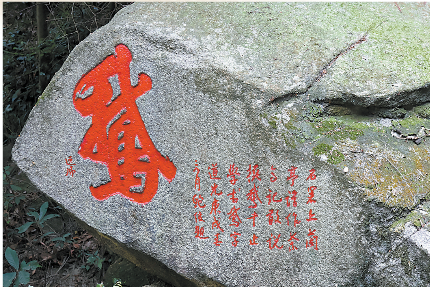
鲍俊石溪摩崖石刻“一笔鹅”