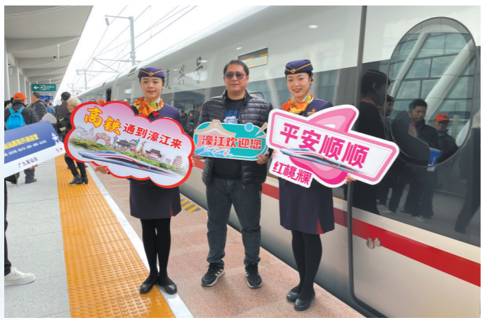
汕汕铁路开通