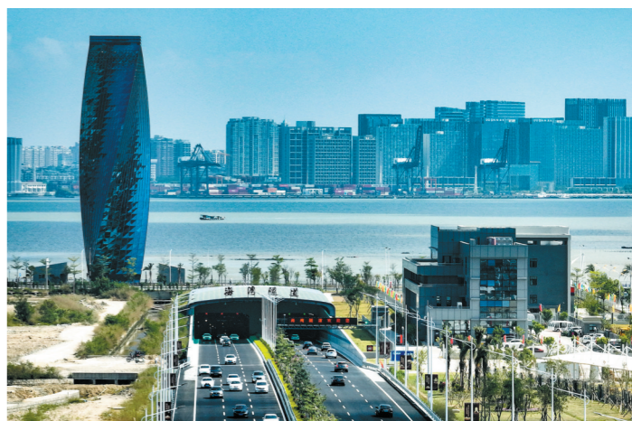
近年来,汕头交通不断提档升级。图为海湾隧道

同时汕头将强化都市圈核心城市功能,构建以汕头为核心的都市圈“三环十射”高速公路网络,强化高速公路对港口、机场、铁路交通枢纽等重要节点的覆盖和服务,实现全域15分钟上高速公路。