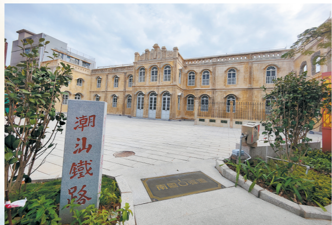
潮汕铁路公司总务处车务处旧址

抗战胜利后,汕头各个码头渐渐得到建设,而潮汕铁路公司难以再次恢复铁路运营,于是在原铁路路基的基础上将其开辟为公路,成为了如今的潮汕路,俗称铁路线。曾经盛极一时的潮汕铁路走下历史舞台,汕头铁路发展等待重启新的篇章。