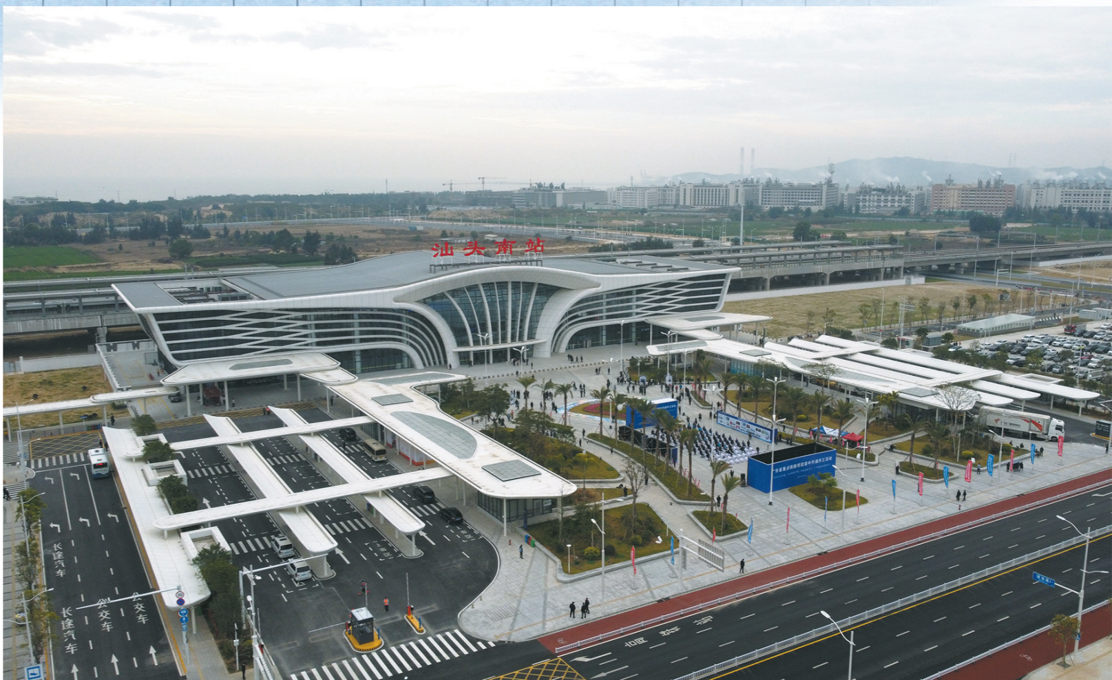
投入使用的汕头南站

一列列在铁轨上疾驰的高铁,打开了汕头铁路高质量发展的新局面,从十年前厦深铁路开通运营,到如今汕汕高铁建成通车,从“一条线”到“一张网”,迈入“双高铁”时代的汕头正如飞奔的列车,积极抢抓区域协调发展新机遇,在文旅融合发展、城市建设、产业升级、招商引资、优化营商环境、基础设施建设等方面持续发力,推动经济社会发展再上新台阶,构建起现代化立体交通网络,向着“省域副中心城市”坚定前进。