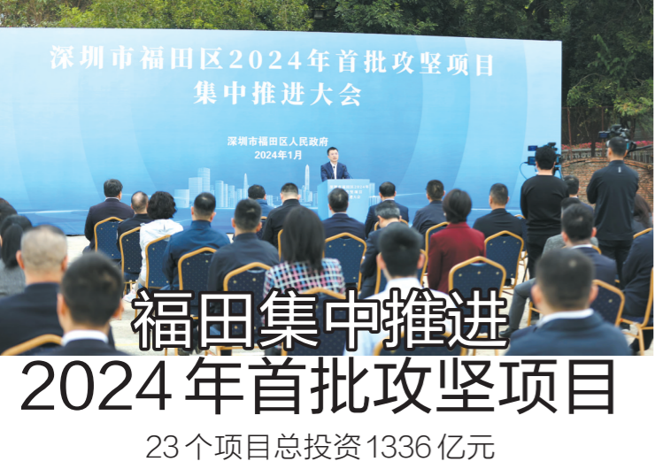
推进会场

救援现场路况复杂,大型车辆进去怎么办?深圳市贝特机器人有限公司的消防机器人搭载了大流量的消防水炮和360度防爆云台摄像机,可实现高效救援。“智慧”的力量支撑着城市的安全运行,保障着人们的生命财产安全。”深圳市应急管理局党委书记、局长马鸿雁说。