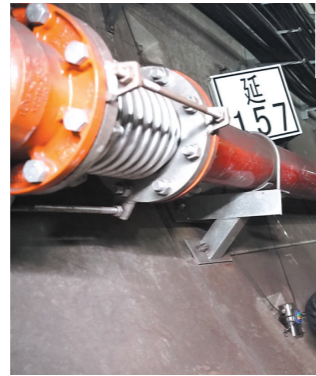
深圳地铁5号线正在开展光纤地震监测阵列安装与调试

40多年来,从祖国南部沿海的小渔村发展成为如今的国际化大都市,深圳这座城市的空间结构、生产方式、组织形态和运行机制都发生了深刻变化。