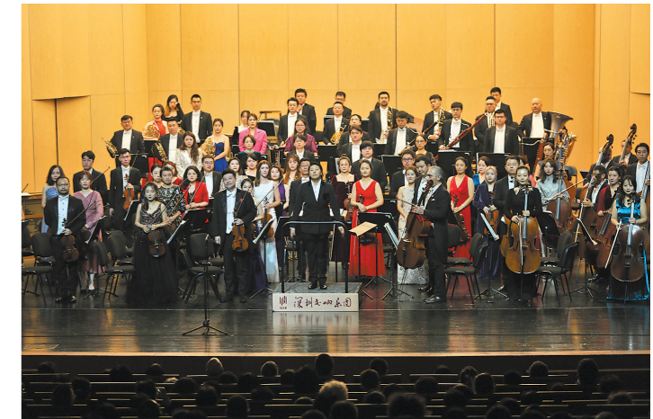
音乐会现场

羊城晚报讯 记者王俊报道:作为深圳市重要的年度文化品牌活动,深圳交响乐团2023-2024 音乐季之“2024 龙岗新年音乐会”近日在龙岗文化中心大剧院精彩唱响。