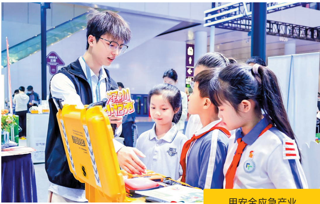
第二十五届中国国际高新技术成果交易会应急安全科技展会展现场