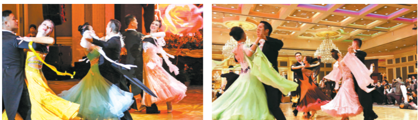
往届新年舞会美不胜收，给观众留下了许多难忘的记忆